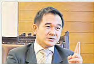
กฤษฎา จีนะวิจารณ์

กฤษฎา จีนะวิจารณ์ อธิบดีกรมสรรพสามิต ยังไม่ทันไปนั่งเป็นอธิบดีกรมศุลกากร อย่างเป็นทางการ วันที่ 1 ต.ค.นี้ ก็โดนรื้อก่อนไปเสียแล้ว เมื่ออยู่ดีๆ ก็มีข่าวว่ากรมสรรพ