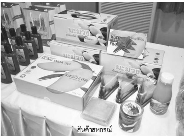
สินค้าสหกรณ์