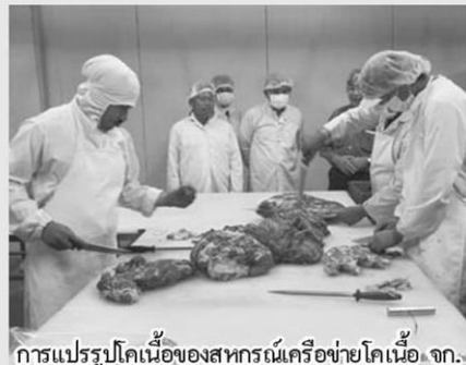
การแปรรูปไคเนื้อของสทกรณเครือข่ายไคเนื้อ จก.

นอกจากนี้ สิ่งที่รองนายกรัฐมนตรีได้เน้นย้ำกับสทกรณเครือข่ายไคเนื้อคือ อยากรให้สทกรณ