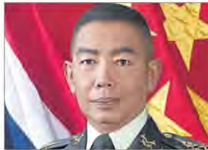
พล.อ.อภิรัชต์ คงสมพงษ์

●●...สำนักงานสลากฯ ขึ้นแท่นอันดับ 1 รัฐวิสาหกิจนำส่งรายได้เข้ารัฐมากที่สุดติดต่อกันมาหลายเดือน เพราะยอดการพิมพ์สลากล่าสุดอยู่ที่ 88 ล้านฉบับ คิดเป็นยอดขายตกงวดละกว่า 3,000 ล้านบาท ถือเป็นอีกผลงานชิ้นโบแดงของ “บิ๊กแดง” พล.อ. อภิรัชต์ คงสมพงษ์ ในฐานะประธานบอร์ดสลากฯ