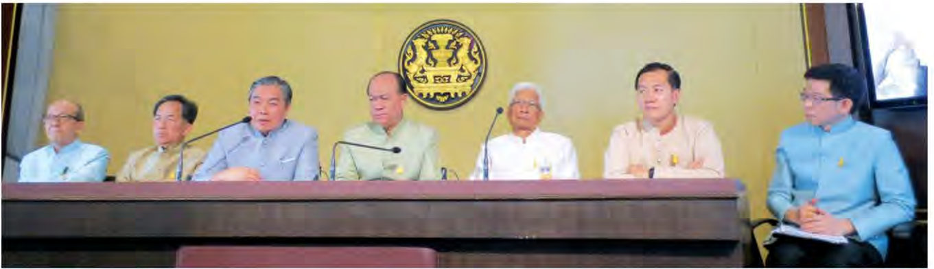
▲ เดิหน้า : พล.อ.อนุพงษ์ เผ่าจินดา รมว.มหาดไทย นำทีมรัฐมนตรีอีก 6 กระทรวง ร่วมแถลงข่าวการเดินหน้านักดับโครงการไทยนิยมยั่งยืน ใช้งบร่วม 100,000 ล้านบาท ลงสู่หมู่บ้านเดือนมิถุนายนนี้

นายกฯสั่งคิกออฟโครงการไทยนิยมยั่งยืน อัดฉีดเงินลงพื้นที่ 1 แสนล้านบาท ออกสู่ระบบม.ย.นี้ เริ่มเปิดรับคำขอโครงการส่งเสริมกองทุนหมู่บ้าน พ.ค.นี้