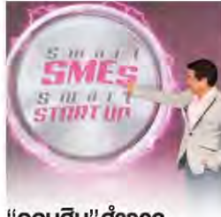
"ออมสิน"สำรวจ ความเชื่อมั่นStartup