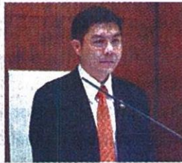
ธอส.ปล่อยกู้คนจน เปิดโอกาสหากันกู้รวมซื้อบ้าน