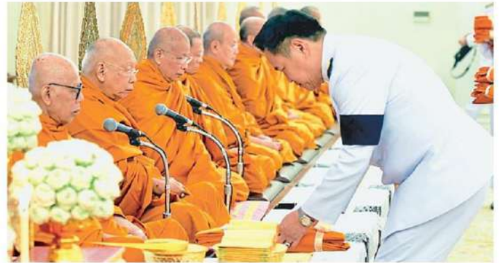
นายอนุทิน ชาญวีรกูล นายกรัฐมนตรี และ รว.มหาดไทย เป็นประธาน ในพิธีบำเพ็ญกุศลปณธสมวาร (ครบ 15 วัน) เพื่ออุทิศถวายเป็นพระกุศลแด่ สมเด็จพระเจ้าลูกเธอ เจ้าฟ้าพัชรกิติยาภา ฌ ทำเนียบรัฐบาล.