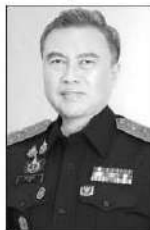
พรชัย สุริยะเวช

ข้อกังขาเรื่องผลประโยชน์ส่วนตัว แม้การจ่ายเงินรางวัลจะชอบด้วยกฎหมาย แต่หากส่งผลต่อความเป็นกลางในการบังคับใช้กฎหมาย ก็ต้องปรับเปลี่ยนเพื่อยกระดับมาตรฐานความโปร่งใสขององค์กร เพื่อเป็นการวางรากฐานขององค์กรที่แสดงให้เห็นถึงการยึดถือความถูกต้องเหนือผลประโยชน์ จากนั้นกรมศุลกากรจะทบทวนการจ่ายเงินรางวัลศุลกากรในภาพรวม และเสนอแก่ใจพระราชบัญญัติศุลกากร พ.ศ.2560 เพื่อยกเลิกการจ่ายเงินรางวัลศุลกากรของพนักงานทุกระดับ เพื่อให้ระบบการบังคับใช้กฎหมายของกรมฯตั้งอยู่บนหลักความเป็นธรรม ได้รับความเชื่อมั่นจากสังคมอย่างยั่งยืน”....!! อืม...คนพูดนั้นได้หน้า...ได้แสง...หน้าบานเป็นจางเหงิง...ไปเลย...ส่วนพนักงานคนอื่นๆ ในกรมศุลกากรก็หน้าเหี่ยวกันไป...เชื่อว่าเกินครึ่งในกรมศุลกากร...ไม่เห็นด้วย...!! ใครเจอหน้า...คุณพรชัย สุริยะเวช อธิบดีกรมสรรพสามิต...อย่าไปถามแถมจะเดินตามรอยกรมศุลกากรหรือเปล่า...เดี๋ยวแถมจะหาหน้าไม่ออกและลำบากใจที่จะตอบ...สำหรับ...แวดวงการเงิน...เรื่องกฎหมายที่มีอยู่เพื่อป้องกันการทุจริตของไทยมีอยู่เยอะไม่แพ้ใครในโลก...แต่อย่างเดียวที่เราไม่เหมือนคนอื่นในโลกคือ...การบังคับใช้กฎหมาย เพราะเอาเข้าจริง...การทุจริตคอร์รัปชันของไทยไม่เคยหายไปไหนเลย ซ้ำยังรุนแรงมากขึ้นด้วย ดูตัวอย่าง...การทุจริตสอบเข้ารับราชการท้องถิ่น...ที่เป็นเรื่องเป็นราวอยู่ตอนนี้สักลับ...บอกได้เลยไม่มีอะไรจะ “อึ้งในอึ้ง” มากกว่านี้แล้วละ...■ ■