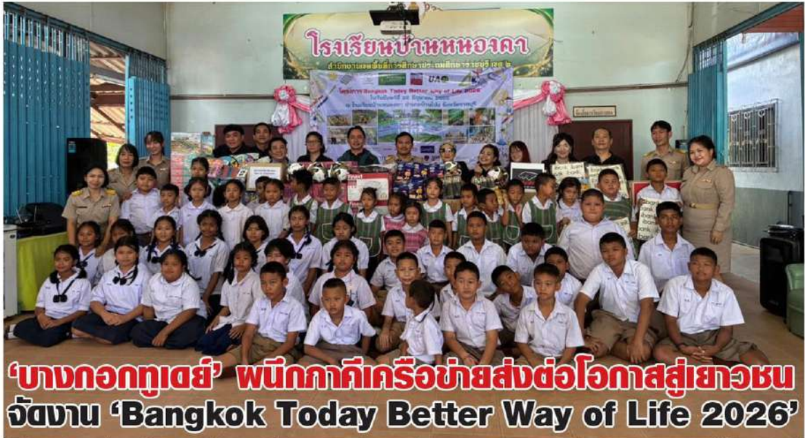
'บางกอกทูเดย์' ผนึกภาคีเครือข่ายส่งต่อโอกาสสู่เยาวชน จัดงาน 'Bangkok Today Better Way of Life 2026'

หัวข้อข่าว: 'บางกอกทูเดย์' ผนึกภาคีเครือข่ายส่งต่อโอกาสสู่เยาวชน จัดงาน 'Bangkok Today Better Way of Life 2026'