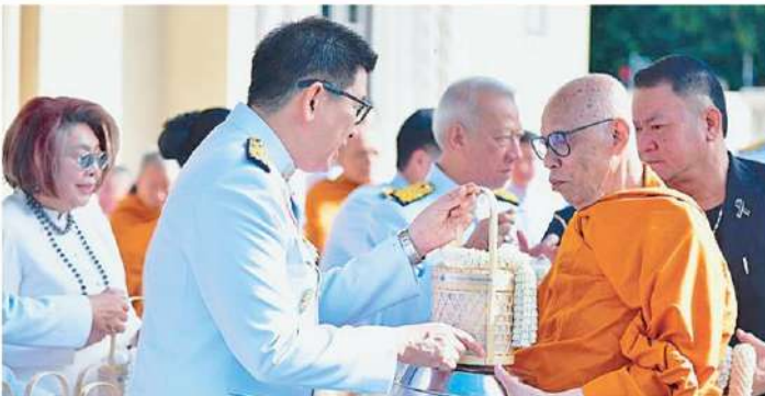
นายเอกนิต นิตินันท์ประภาส รองนายกรัฐมนตรี และ รว.คลัง ร่วมทำบุญตักบาตรถวายเป็นพระกุศลแด่ "พระองค์ภา" ฌ ทำเนียบรัฐบาล.