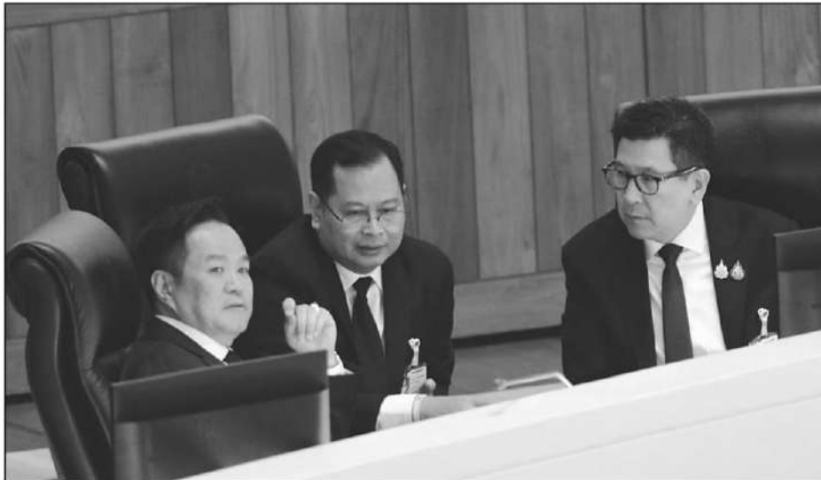
นายอนุทิน ชาญวีรกูล นายกรัฐมนตรีและ รมว.มหาดไทย นายเอกนิติ นิติทัณฑ์ประภาศ รองนายกฯ และ รมว.การคลัง และนายปรกรณ์ นิลประพันธ์ รองนายกฯ กำลังหารือกันระหว่างประชุมสภา วาระพิจารณา ร่างพระราชบัญญัติ (พ.ร.บ.) โอนงบประมาณรายจ่าย พ.ศ. ... ที่รัฐสภา เมื่อวันที่ 25 มิ.ย.ที่ผ่านมา.