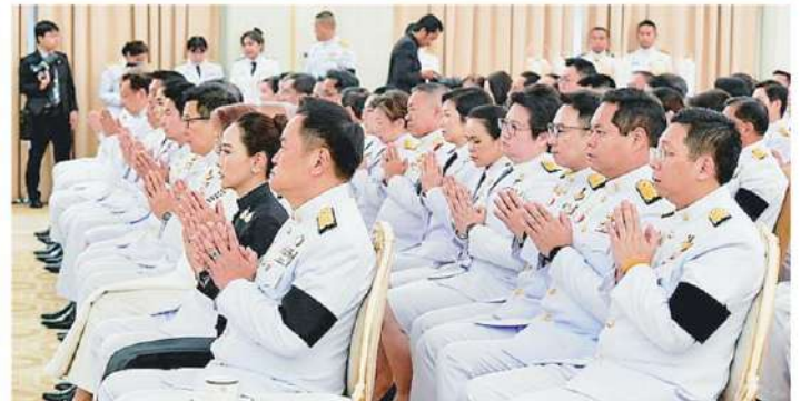
นายอนุทิน ชาญวีรกูล นายกรัฐมนตรี นำคณะรัฐมนตรีร่วมพิธีบำเพ็ญ กุศลปณธสมวาร เพื่ออุทิศเป็นพระกุศลแด่ "พระองค์ภา" ฌ ทำเนียบรัฐบาล.