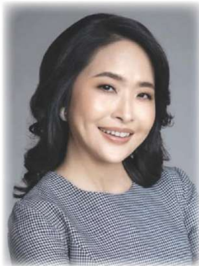
ดารบุษย์ ปภากจน์

ทั้งนี้ กองทุนเปิดอีส์ทส์สปริง Income Plus (ES-IPLUS) มีความเสี่ยงระดับ 4 ลงทุนในเงินฝาก ตราสารแห่งหนึ่งภาครัฐและหรือภาคเอกชน และหรือหุ้นกู้สกุลเงินตราต่างประเทศที่เสนอขายในประเทศไทย (FX bond)