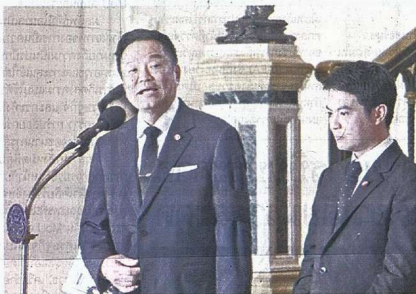
อนุทิน ชาญวีรกูล นายกรัฐมนตรี

ทั้งนี้ สำนักงานสภาพัฒนาการเศรษฐกิจและสังคมแห่งชาติ (สศช.) ประเมินว่า เศรษฐกิจไทยปี 2570 มีแนวโน้มขยายตัว ร้อยละ 1.7-2.7 ตามการฟื้นตัวดีขึ้นของเศรษฐกิจและการค้าโลก จะช่วยสนับสนุนการขยายตัวของภาคการส่งออกสินค้าและบริการ ขณะที่อุปสงค์ภายในประเทศ ทั้งการบริโภคและการลงทุนภาคเอกชนขยายตัวอย่างต่อเนื่อง รวมถึงแรงสนับสนุนจากการใช้จ่ายภาครัฐและงบประมาณภายใต้ พ.ร.ก.ให้อำนาจกระทรวงการคลั่งกู้เงินเพื่อแก้ไขปัญหาผลกระทบจากสถานการณ์วิกฤตด้านพลังงาน และสร้างการเปลี่ยนผ่านด้านพลังงานของประเทศ พ.ศ.2569