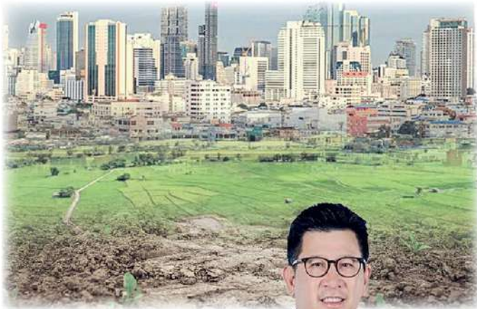
เอกนิติ นิติทัณฑ์ประภาศ

นายเอกนิติ นิติทัณฑ์ประภาศ รองนายกรัฐมนตรี และ รมว.คลัง เปิดเผยถึงการประเมินราคาที่ดินและสิ่งปลูกสร้างรอบปีบัญชีใหม่ว่า ได้สั่งการให้กรมธนารักษ์ดำเนินการจัดทำราคาประเมินที่ดินและสิ่งปลูกสร้างรอบใหม่ ซึ่งจะประกาศเริ่มใช้ปี 70-73 โดยนโยบายรอบนี้ราคาประเมินใหม่ต้องสะท้อนความเป็นจริงและใกล้เคียงกับภาวะเศรษฐกิจปัจจุบันมากขึ้น