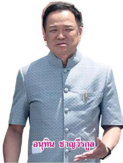
อนุทิน ชาญวีรกูล

“ไทยมีความพร้อมด้านสาธารณูปโภค โลจิสติกส์ และเครื่องมือสื่อสารที่ทันสมัยอยู่แล้ว แต่จุดที่ล่าช้าที่สุดคือ การอนุมัติ ซึ่งรัฐบาลมองว่าคือความด้อยประสิทธิภาพของระบบราชการที่ยอมรับไม่ได้ โดยเป้าหมาย