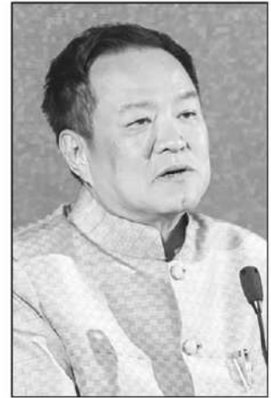
อนุทิน ชาญวีรกูล

“ในวันนี้ได้คัดเลือกและมอบบัตร Thailand FastPass ให้สำหรับโครงการลงทุนที่มีความสำคัญในอุตสาหกรรมยุทธศาสตร์ของประเทศจำนวน 25 โครงการ จาก 23 บริษัท ซึ่งมีมูลค่าการลงทุนรวมกว่า