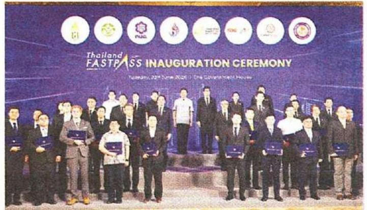
FastPass : อนุทิน ชาญวีรกูล นายกรัฐมนตรีและรัฐมนตรีว่าการกระทรวงมหาดไทย, ดร. เอกนิติ นิติทัณฑ์ประภาศ รองนายกรัฐมนตรีและรัฐมนตรีว่าการกระทรวงการคลัง ร่วมพิธีเปิด Thailand FastPass เพื่อเร่งรัดการลงทุน ณ ดิกลันด์โมเดิร์น (หลังนอก) ทำเนียบรัฐบาล