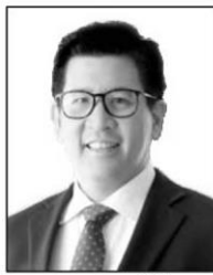
ดร.เอกนิติ นิติทัศน์ประกาศ

■ ■ แวดวงการเงิน...ได้ยินมาว่า ดร.พรชัย จีระเวช อธิบดีกรมสรรพสามิต อยู่ระหว่าง เสนอปรับโครงสร้างภาษีสรรพสามิตบุหรี่ ให้กระทรวงการคลังและคณะรัฐมนตรีให้ความเห็นชอบ...ก็รู้สึกได้ว่าท่านมีความมุ่งมั่นตั้งใจจริงอยากทำให้มันเกิดขึ้นตามที่ได้เคยกล่าวไว้ตั้งแต่ปลายปีที่แล้ว แม้เพิ่งมารับตำแหน่งได้ไม่ถึง 4 เดือน น่าเสียดายที่มีการยุบสภาไป...จนเห็นว่าท่านกลับมานำเสนอเรื่องนี้อีกครั้ง ก็ขอเป็นกำลังใจให้ทำให้สำเร็จลุล่วงไปด้วยดี เพราะนี่คือปัญหาอันดับหนึ่งของกรมสรรพสามิตที่ต้องได้รับการแก้ไขโดยเร็ว ก่อนที่จะไปทำนโยบายใหม่อื่นๆ...แวดวงการเงิน เองก็บ่นจนเมื่อยปากกับเรื่องภาษีบุหรี่ 2 เทียร์ ที่แยกเก็บภาษีบุหรี่ราคาถูกและราคาแพงในอัตราที่ต่างกัน จนทำให้ทุกคนหนีลงไปแข่งขันค้าขายในเทียร์ล่างราคาประหลาดกันหมด เรียกว่า "มดลงต่ำกันหมด" เพราะไม่มีใครอยากขายของที่ต้องเสียภาษีในอัตราที่สูง จนเกิดการปั่นป่วนไปทั้งตลาด (มากกว่า 95%) ของบุหรี่ในประเทศเสียภาษีในอัตราที่ต่ำกันหมด..เห็นได้ชัดๆ ว่ามีที่ประเทศไหนบ้างคุณเดินไปซื้อบุหรี่ แต่บุหรี่กลับมีแค่ 2 ราคา 70 และ 100 กว่าบาท