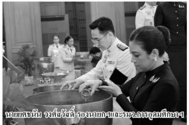
นายศษนัน วงศ์สวัสดิ์ รองนายกฯและรมว.การอุดมศึกษาฯ