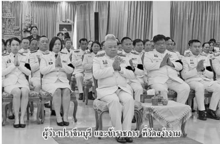
ผู้ว่าฯปราจีนบุรี และข้าราชการ ที่วัดสง่างาม