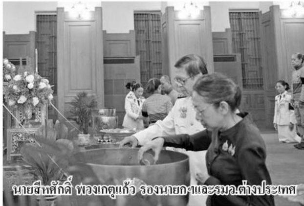
นายสีหศักดิ์ พวงเกตุแก้ว รองนายกฯและรมว.ต่างประเทศ