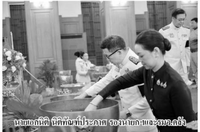
นายเอกนิติ นิติทัณฑ์ประภาศ รองนายกฯและรมว.คลัง