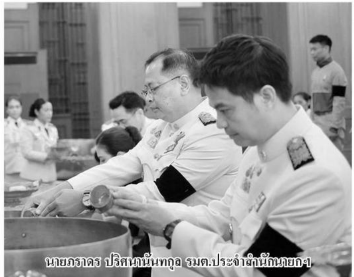
นายภราดร ปริศนานันทกุล รมต.ประจำสำนักนายกรัฐมนตรี