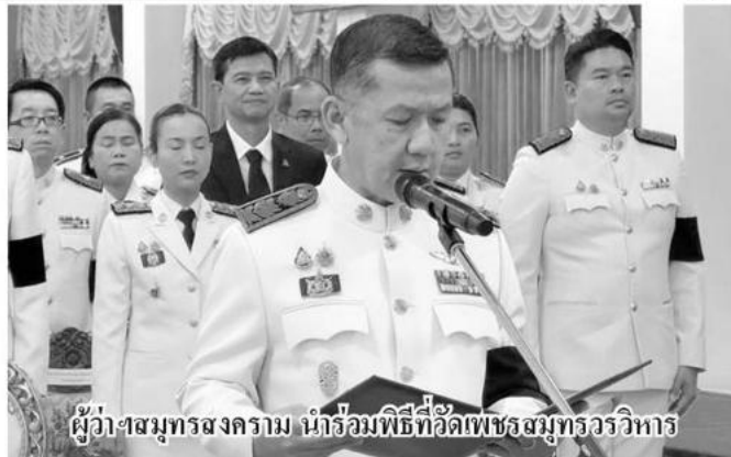
ผู้ว่าฯสมุทรสงคราม นำร่วมพิธีที่วัดเพชรสมุทรวรวิหาร