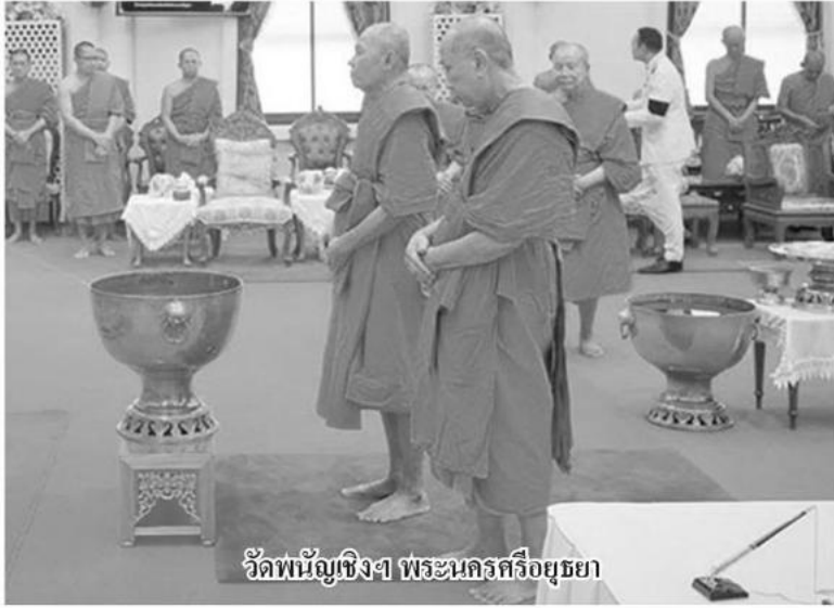
วัดพัญญูเชิงฯ พระนครศรีอยุธยา