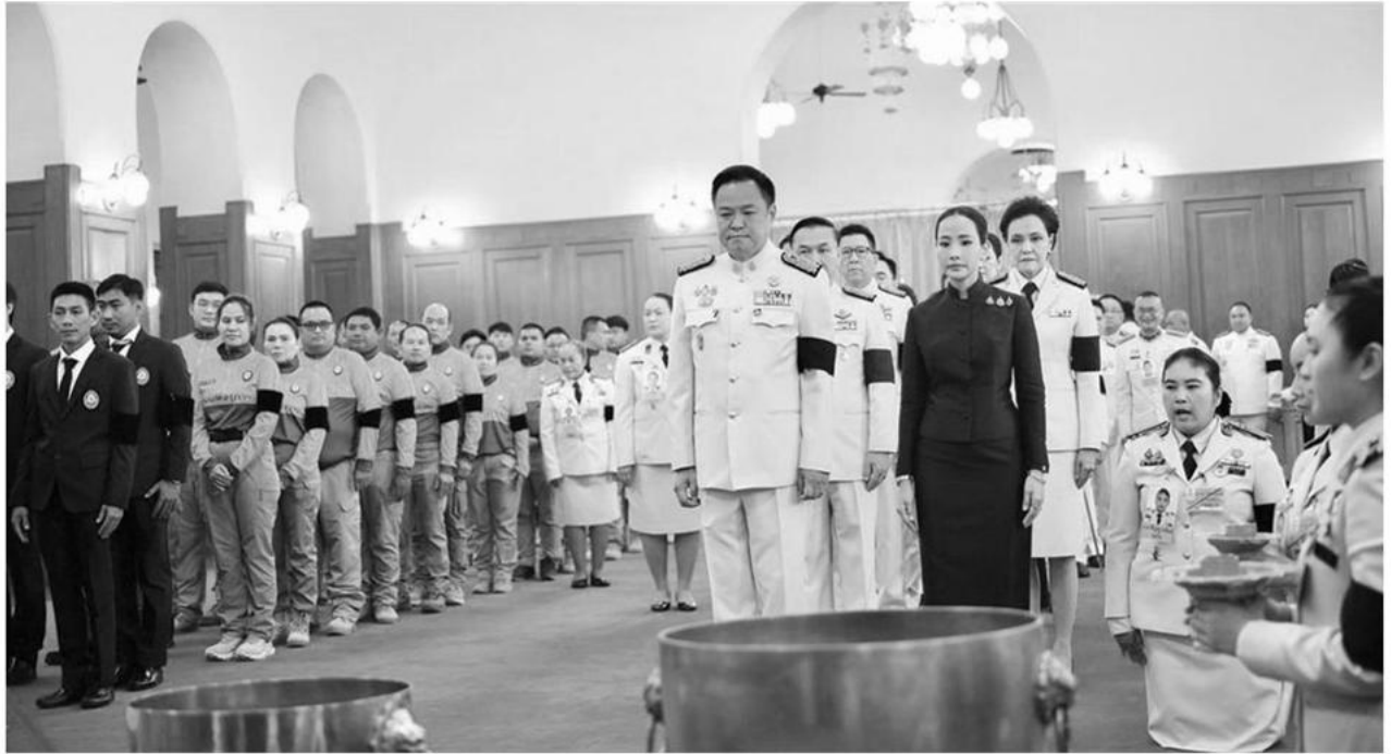
นายอนุทิน ชาญวีรกูล นายกรัฐมนตรีและรมว.มหาดไทย นำคณะรัฐมนตรี ผู้บริหารกระทรวง หน่วยงานราชการ พร้อมด้วย คณะบุคคล ประชาชน เข้าถวายน้ำสรงพระศพเบื้องหน้าพระรูป เจ้าฟ้าพัชรกิติยาภา ที่ศาลาสหทัยสมาคม ในพระบรมมหาราชวัง ส่วนในต่างจังหวัดจัดพิธีถวายน้ำสรงพระศพทุกจังหวัด เมื่อวันที่ 13 มิ.ย.