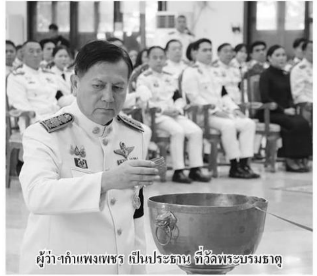
ผู้ว่าฯ กำแพงเพชร เป็นประธาน ที่วัดพระบรมธาตุ