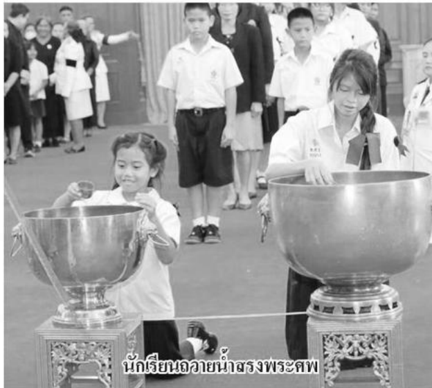
นักเรียนถวายน้ำสรงพระศพ