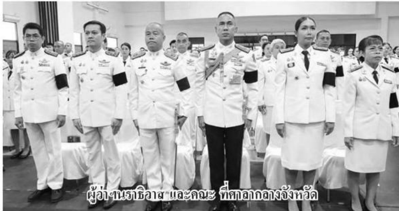
ผู้ว่าฯนราธิวาส และคณะ ที่ศาลากลางจังหวัด