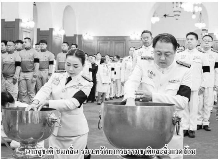
นายสุชาติ ชมกลิ่น รมว.ทรัพยากรธรรมชาติและสิ่งแวดล้อม