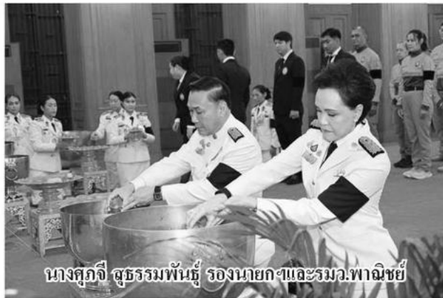
นางศุภจี สุธรรมพันธุ์ รองนายกฯและรมว.พาณิชย์