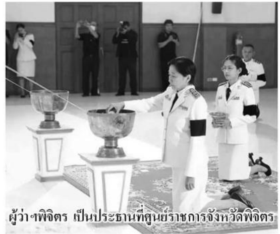
ผู้ว่าฯพิจิตร เป็นประธานที่ศูนย์ราชการจังหวัดพิจิตร