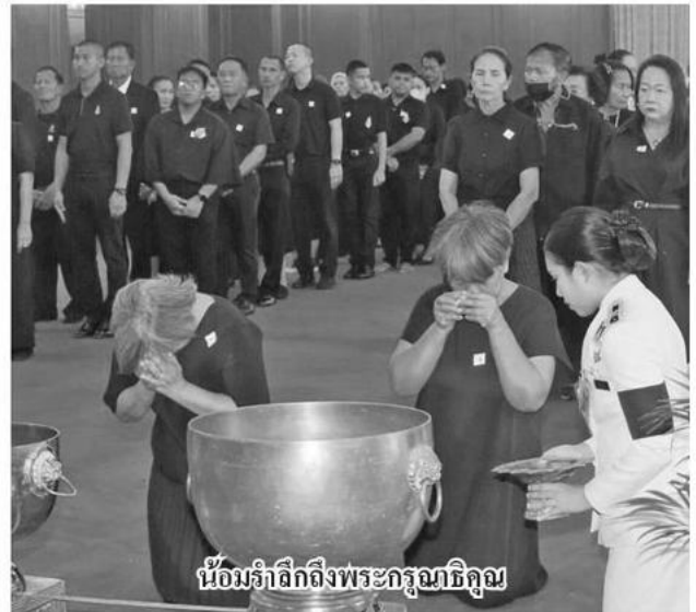
น้อมรำลึกถึงพระกรุณาธิคุณ