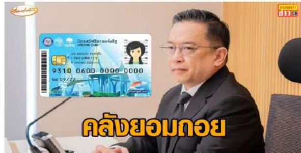
คลังยอมถอย ยกเลิกเงื่อนไขใช้ชื่อพ่อแม่ลดหย่อนภาษี เกณฑ์ตัดสิทธิบัตรคนจนรอบนี้