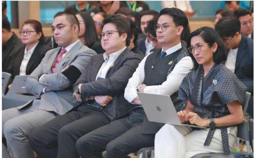
ร่วมเวที - นายไชยชนก ชิดชอบ รมว.ดิจิทัลฯ ร่วมเวทีรับฟังและแลกเปลี่ยนความคิดเห็นโครงการ TH-AI Passport ซึ่งกำลังถูกวิพากษ์วิจารณ์อย่างหนักเกี่ยวกับความโปร่งใส และเชื้อประโยชน์พวกพ้อง ที่กระทรวงดิจิทัลฯ ศูนย์ราชการแจ้งวัฒนะ กทม. เมื่อวันที่ 11 มิ.ย.

ส่วนกลุ่มอยู่ในรายชื่อของกระทรวงมหาดไทยและพม. ตัวเลขล่าสุดมี 1,047,520 คน จะมีเจ้าหน้าที่ไปตามหาว่าต้องการลงทะเบียนหรือไม่ ซึ่งขณะนี้ติดตามไปแล้วร้อยละ 70 ขณะที่กลุ่มที่รายชื่อตกหล่น