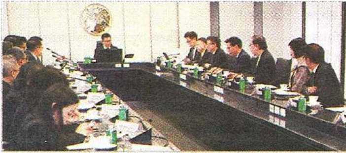
หารือตลาดหุ้นไทย: ดร.เอกนิติ นิติทัณฑ์ประภาศ รองนายกรัฐมนตรีและรัฐมนตรีว่าการกระทรวงการคลัง เป็นประธานการประชุมหารือกับสภาธุรกิจตลาดหุ้นไทย (FETCO) และตลาดหลักทรัพย์แห่งประเทศไทย (ตลท.) เพื่อแลกเปลี่ยนความคิดเห็นเกี่ยวกับแนวทางและมาตรการต่าง ๆ ในการสนับสนุนตลาดหุ้น โดยมีผู้บริหารกระทรวงการคลัง และผู้แทนหน่วยงานที่เกี่ยวข้อง ร่วมการประชุม

หัวข้อข่าว: 'คลัง-FETCO' ปลุกหุ้นไทย จ่อชงครม.ไฟเขียว TISA