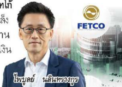
ไพบูลย์ นลินทรวงกู