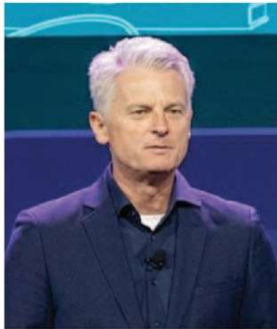
รอล์ฟ ฮอปเตอร์

สำหรับประเทศไทยได้เห็นว่ากำลังเปิดรับโอกาสนี้อย่างเต็มที่ การจะชัยบเคลื่อนประเทศสู่ “Frontier Transformation” แนวหน้าด้าน AI จะเกิดขึ้นได้ก็ต่อเมื่อ