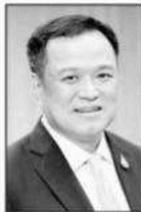
อนุทิน ชาญวิวิธกุล

คุณเอกนิติ นิติทัณฑ์ประภาศ รองนายกรัฐมนตรีและรัฐมนตรีว่าการกระทรวงการคลัง...ก็ยืนยันเหมือนกันว่าจะไม่มีการแก้ไขเรื่องคุณสมบัติผู้ถือ "บัตรคนจน"...และพูดเหมือนกันว่ารัฐตั้งใจจะช่วยคนที่จนจริงๆ...และคุณอนุทินยังบอกอีกว่า "เรื่องนี้ไม่เห็นมีใครบ่นมีแต่คนพอใจ"...!! ไปอยู่ที่ไหนมาครับนายกฯ...หรือแค่เลือกที่จะฟังแต่เสียงสะท้อนที่ดีๆ...เรื่องข้อบกพร่องของรัฐกลับทำเป็นหูหนวก...!! อย่างนี้รับนายกฯ...คนไทยที่มีรายได้ตั้งแต่ 26,000 บาทขึ้นไปต้องยื่นภาษี...ขั้นต่ำสุดก็ 5% และก็เพิ่มเป็นขั้นบันไดไปสูงสุดที่ 35% (รายได้เกิน 5 ล้านบาท/ปี)...กลุ่มคนที่น่าหวังคือกลุ่มที่มีรายได้ 2.6-3 หมื่นบาทนี้แหละ...ซึ่งส่วนใหญ่ก็เป็นกลุ่มคนที่ทำงานใหม่หรือทำงานไม่เกิน 3 ปี...จำนวนไม่น้อยที่ต้องทำงานนอกพื้นที่ ในกรุงเทพฯบ้าง หัวเมืองใหญ่บ้าง...ภาระต่อเดือน 1.เลขค่าเช่าบ้าน-คอนโดฯ 5-8 พันบาท...ค่าเดินทาง (กรณีไม่มีรถ) 3-4 พันบาท...รายไหนผ่อนรถค้างงวด 5-7 พันบาท...ถ้าใช้จ่ายส่วนตัวแบบกินอย่างประหยัดสุดๆ ก็ 6 พันบาท...ถ้าใช้จ่ายอื่นๆ ทางสังคมอีก 3 พันบาท...!! คิดว่าพวกเขาจะเหลือเงินส่งให้พ่อแม่-แม่-สักที่บาทต่อเดือน...แล้วพ่อแม่แม่แก่ของลูกกลุ่มนี้ก็เชื่อว่าจะมีรายได้ทุกคน...ต้องเผื่อรอลูกหลานส่งเงินไปให้...อย่าว่าแต่กลุ่มคนมีรายได้ 2.6-3 หมื่นบาท/เดือนเลย...ในยุคนี้ที่ค่าครองชีพสูงแจ่มหน้ารายได้...มีรายได้ 4-5 หมื่นบาท/เดือน...ก็เชื่อว่า "ชักหน้าถึงหลัง"...!! ทำงานให้ละเอียดกว่านี้ก็คงไม่มี "ดราม่า"...ข้อมูลคนยื่นภาษีก็มีในมือเอามา "คิดวิเคราะห์แยกแยะ" สักหน่อยคงทำได้ไม่ยากหรอกมั้ง...■ ■