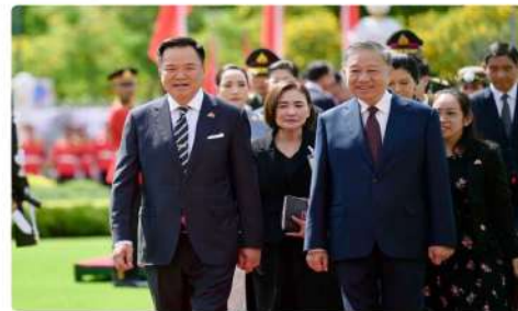
Prime Minister Amutin Charuvirakul, left, walks alongside To Lam, President of Vietnam and General Secretary of the Communist Party, at Government House on May 28. (25am Government House)

PUBLISHED: 6 JUN 2026 06:57 NEWS/OPINION EDITOR: NEWS | WRITER: ANUSIN CHANVIRAKUL