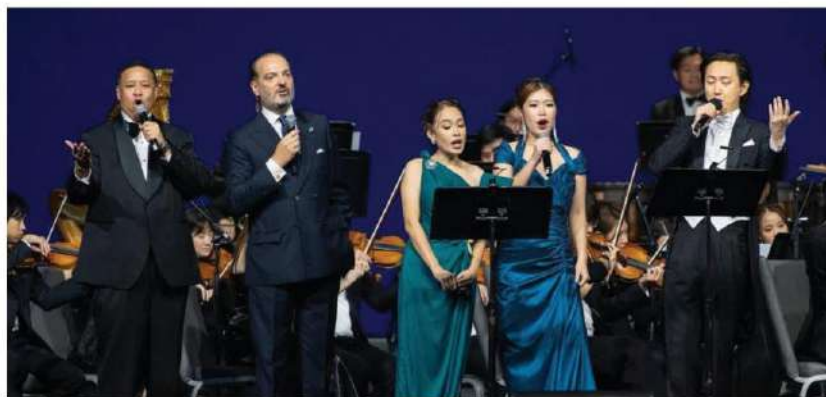
The ambassador performs with the Thailand Philharmonic Orchestra.