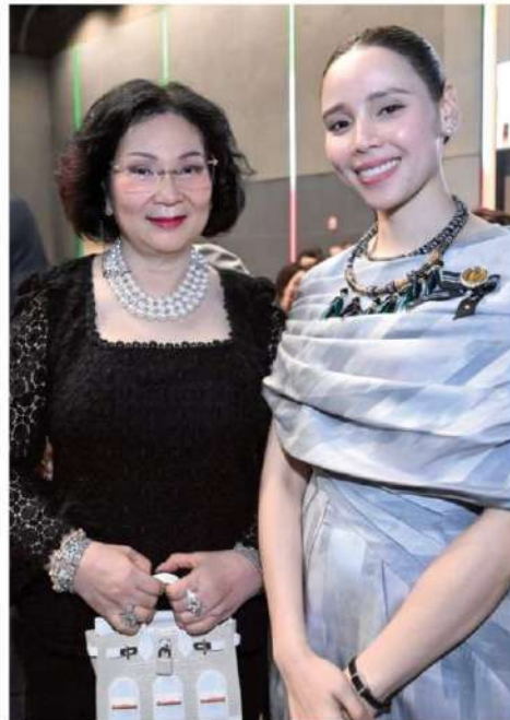
Khunying Patama Leeswadtrakul, IOC member and president of the Thailand Philharmonic Orchestra, poses for a photograph with Culture Minister Sabeeda Thaised.

The celebrations were complemented by an exhibition showcasing Italian excellence in Thailand, featuring achievements in automotive engineering, design, shipbuilding, cosmetics and fashion.