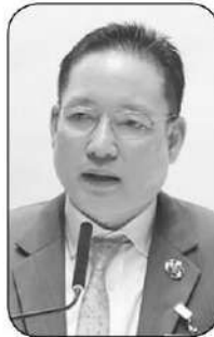
ผยง ศรีวณิช

...บันทึกในวันที่ตลาดร้านรวงพ่อค้าแม่ขายรู้สึกตึกคักๆ เพราะโครงการ “ไทยช่วยไทยพลัส” ส่งแรงหนุนให้ผู้คนกล้าออกมาจับจ่ายใช้สอยเพิ่มขึ้นกว่าปกติ โดยสำนักงานเศรษฐกิจการคลังมีรายงานว่าตั้งแต่กุมภาพันธ์เปิดโครงการจนถึงเมื่อวันที่ 6 มิ.ย. มียอดใช้จ่ายรวม 15,239.76 ล้านบาท แยกเป็นเงินที่รัฐบาลร่วมจ่าย (60%) 8,862.30 ล้านบาท เงินที่ประชาชนจ่าย (40%) 6,377.46 ล้านบาท ..ถึงแม้จะไม่ถึงขั้นที่ตะโกนออกสื่อว่า “รวยไม่ไหว” แต่ก็นับได้ว่าเพิ่มความสดชื่นกันได้พอสมควรในยามนี้ ...● จากความตึกคักเมื่อปลายเดือนที่เห็นหน้าแบงก์กรุงไทย เพราะมีประชาชนสนใจเข้าร่วมในโครงการไทยช่วยไทยพลัส ตามมาด้วยชาวบ้านแห่กันไปอัปเดตสิทธิบัตรสวัสดิการแห่งรัฐ ซีอีโอกรุงไทย ผยง ศรีวณิช สั่งทีมงานดิจิทัลเร่งสปีดการให้บริการสำหรับการลงทะเบียน ผลปรากฏว่า สามารถใช้เวลาไม่ถึง 2 นาทีต่อราย งานนี้สะท้อนใจใครบางคนในรัฐบาลชุด “อู๋อึ้ง” กันบ้างหรือเปล่า เพราะเคยปฏิเสธ “แอปเปิ้ลแดง” โดยไม่สนใจเลยว่า เครื่องมือที่มีอยู่ในมือแล้วนั้น จะช่วย