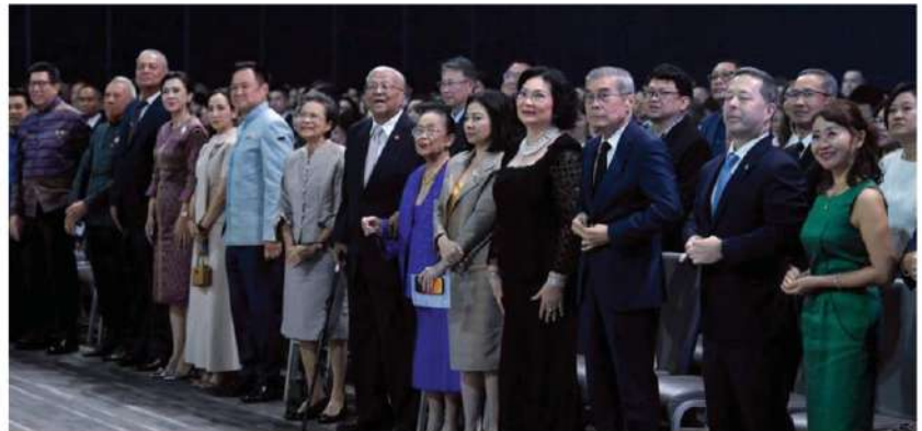
Dignitaries and distinguished guests gather during the grand celebration.