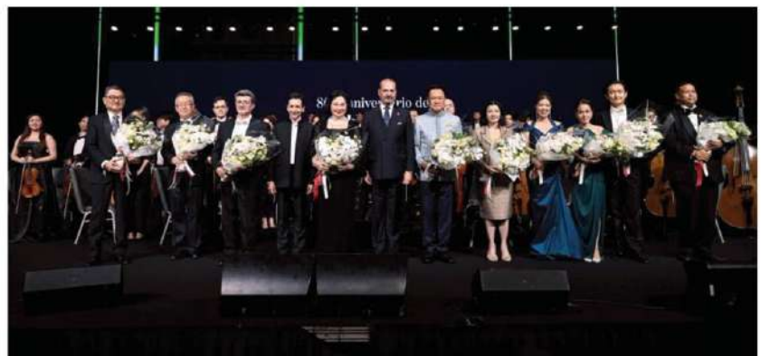
Prime Minister Anutin Charnvirakul joins dignitaries on stage.