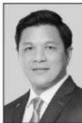
วิทย์ รัตนกร

■ ■ ประชาชนทั่วไปและผู้ประกอบการ SME... เขกันสนั่นและคงจะชอบออกชอบใจ...คุณวิทย์ รัตนกร ผู้ว่าการธนาคารแห่งประเทศไทย (ธปท.)...ที่กล้าหาญออกประกาศปรับลดค่าธรรมเนียม ที่สถาบันการเงิน...เรียกเก็บจากลูกค้า 4 ประเภท รวม 19 รายการ...!! เอาจริงๆ นะบรรดาสถาบันการเงิน ก็ไม่ควรจะขุ่นเคืองท่านผู้ว่าการแบงก์ชาตินะ...เพราะต้องยอมรับว่าบางบริการต้นทุนลดลงเยอะ และบางรายการก็แทบจะไม่มีต้นทุนแล้วเพราะเอาเทคโนโลยีมาช่วย...แต่การยังเรียกเก็บจากลูกค้าก็ต้องถือว่าไม่เป็นธรรมเท่าไรหรือนักหรอก...แม้ว่าจะทำให้ต้องเสียรายได้ไปสัก 5 พันล้านบาท ก็ถือว่า "ชนหน้าแข้งไม่ร่วงอยู่แล้ว"...เพราะปีหนึ่งสถาบันการเงินก็มีกำไรสุทธิ ตั้งปีละกว่า 2 แสนล้านบาท...■ ■ นึกแล้วว่าต้องมี "ดราม่า" เรื่องคุณสมบัติเพิ่มเติมสำหรับคนที่ไม่มีสิทธิได้รับบัตรสวัสดิการแห่งรัฐ "บัตรคนจน"...ซึ่งรอบนี้เน้นเรื่องรายได้ของ "ตัวบุคคล" ไม่ใช่รายได้ของ "ครอบครัว"...ประเด็นที่เป็น "ดราม่า" หนักสุดก็คือ...บิดา-มารดาที่ถูกลูกนำชื่อไปขอลดหย่อนภาษี...เพราะรัฐมองว่าถือว่าเป็นครอบครัวที่มีรายได้พอสมควรถึงเข้าข่ายที่ต้องเสียภาษี...และทั้งคุณอนุทิน ชาญวิวิธกุล นายกรัฐมนตรี และ