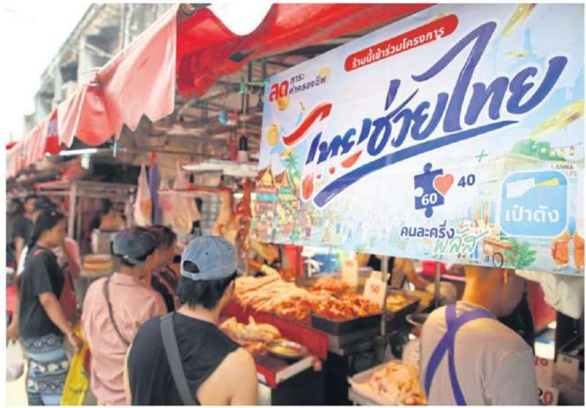
Customers shop at Bang Kapi Market during the co-pay campaign.