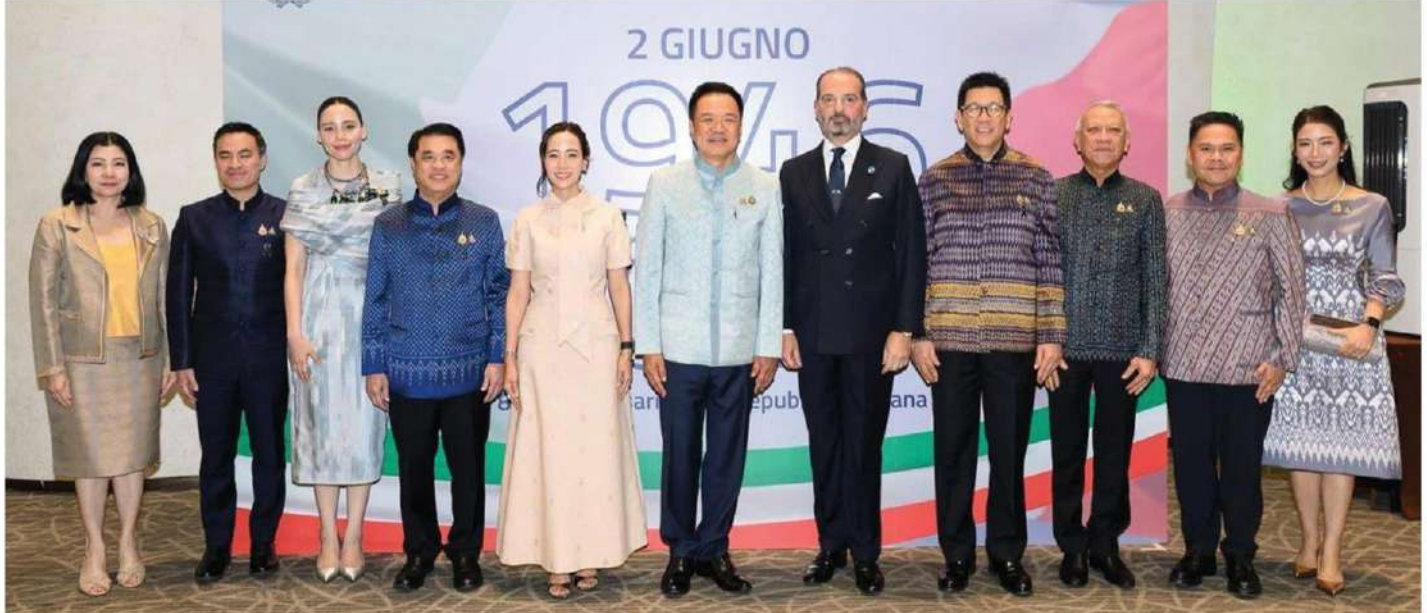
Italian Ambassador Paolo Dionisi poses for a photograph with Prime Minister Anutin Charnvirakul and his wife, alongside senior members of the Thai cabinet and distinguished guests, including Deputy Prime Minister and Finance Minister Ekniti Nitithanprapas and Agriculture and Cooperatives Minister Suriya Juangroongruangkit, during celebrations marking the 80th Anniversary of the Italian Republic.

M ore than 2,400 guests attended celebrations marking the 80th Anniversary of the Italian Republic, hosted by the Italian Embassy in Bangkok at Paragon Hall, Siam Paragon.