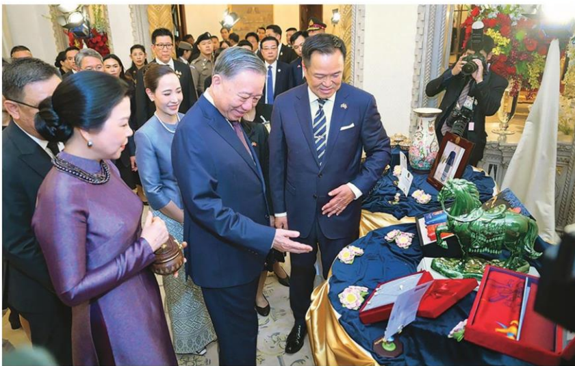
☞ ต้อนรับ - นายอนุทิน ชาญวีรกูล นายกรัฐมนตรี และภริยา ต้อนรับนายโต เลิม ประธานาธิบดี แห่งสาธารณรัฐสังคมนิยมเวียดนาม และภริยา พร้อมนำชมของที่ระลึก ในโอกาสเยือนประเทศไทย อย่างเป็นทางการในฐานะแขกของรัฐบาล ที่ทำเนียบรัฐบาล เมื่อวันที่ 28 พ.ค.

ศาลยกฟ้องธนาร 'อนุทิน'ต้อนรับ 'โต เลิม' คดีม.112-ปมวัคซีน ปลน.เวียดนาม จลอง ทักษิณรายงานตัว สัมพันธ์ 50 ปี ลงนาม ความร่วมมือ 4 ฉบับ ตั้งเป้า เพิ่ม □อ่านต่อหน้า 10