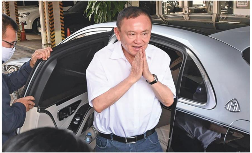
🏠 รายงานตัว - นายทักษิณ ชินวัตร อดีตนายกรัฐมนตรี เข้ารายงานตัวที่สำนักงานคุมประพฤติกรุงเทพมหานคร 1 เขตบางกอกน้อย กทม. ด้วยสำเนาข้อมติจำคุก และกล่าวสั้นๆ ก่อนเดินทางกลับว่า 'ตามประสาคนแก่ ไม่มีอะไร' เมื่อวันที่ 28 พ.ค.

2.ด้านเศรษฐกิจและสังคม เห็นพร้อมร่วมมือกันอย่างใกล้ชิดในการบรรลุเป้าหมายทางการค้า 25,000 ล้านดอลลาร์สหรัฐต่อปีโดยเร็ว ซึ่งขณะนี้อยู่ที่ 24,000 ล้านดอลลาร์สหรัฐ จึงไม่น่าจะไกลเกินเอื้อม อีกทั้งยังได้หารือแนวทางการส่งเสริมความเชื่อมโยงภายใต้ยุทธศาสตร์ 3 connect เพื่อเพิ่มขีดความสามารถยุทธศาสตร์ทางการแข่งขันของทั้งสองประเทศ