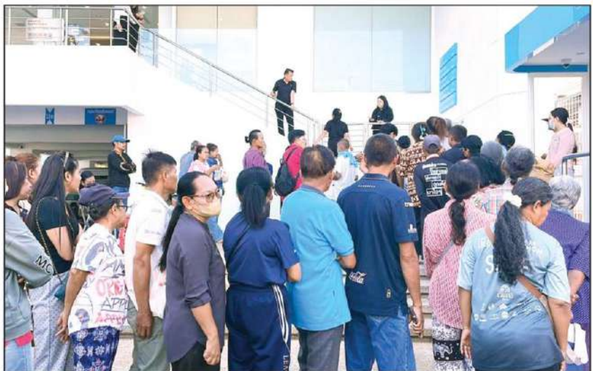
▲ ยืนยันชนิด : บริเวณหน้าธนาคารกรุงไทย สาขาบุรีรัมย์ อำเภอเมืองบุรีรัมย์ จังหวัดบุรีรัมย์ ยังคงมีประชาชนเดินทางมาติดต่อเพื่อยืนยันตัวตนอย่างเนืองแน่นเป็นวันที่ 3 ซึ่งส่วนใหญ่เป็นกลุ่มที่ไม่มีโทรศัพท์มือถือแบบสมาร์ตโฟนและผู้ที่มาลงทะเบียนใหม่ โดยทางธนาคารจัดเจ้าหน้าที่มาคอยชี้แจงขั้นตอน กฎระเบียบ

“สำหรับผู้ลงทะเบียนใหม่ที่ยังคงตกค้างอยู่ในสถานะรอตรวจสอบคุณสมบัติอีกประมาณ 5.9 แสนรายนั้น ทางกระทรวงการคลังคาดการณ์ว่าระบบจะสามารถดำเนินการตรวจสอบให้แล้วเสร็จทั้งหมด พร้อมทั้งส่งข้อความแจ้งผลให้ผู้ลงทะเบียนรับทราบได้ภายใน