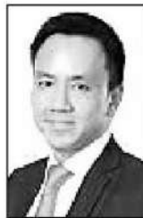
พันธ์ทอง ลอยกุลนันท์

■ ■ ในช่วงปีงบประมาณ 2568-2569... คุณพันธ์ทอง ลอยกุลนันท์ อธิบดีกรมศุลกากร และลูกน้องได้ผ่นึกกำลังกับเจ้าหน้าที่หลายภาคส่วน...ตรวจซัดของกลางประเภทบุหรี่และบุหรี่ไฟฟ้า...รวมมูลค่ากว่า 409 ล้านบาท โดยการจับกุมแต่ละครั้งพบของกลางเป็นจำนวนมาก...อย่างกรณีล่าสุดกรมศุลกากร โดยสำนักงานศุลกากรตรวจของผู้โดยสารท่าอากาศยานสุวรรณภูมิ ตรวจซัดเครื่องบุหรี่ไฟฟ้าและใส่บุหรี่ไฟฟ้า มูลค่ากว่า 900,000 บาท...ซึ่งสังคมจะเห็นข่าวแบบนี้บ่อยๆเป็นประจำ เพราะไล่จับยังไม่หมด ทำอย่างไรก็สกัดไม่อยู่...แต่ๆ หากหันมามองความจริงที่เกิดขึ้นในสังคมไทยปัจจุบัน.... เรื่องของ “บุหรี่ไฟฟ้า” หรือผลิตภัณฑ์ยาสูบยุคใหม่... แวดวงการเงิน บอกได้คำเดียวว่า วันนี้พฤติกรรมผู้บริโภคบ้านเรานั้นเปลี่ยนไปแบบถาวรไม่กลับ และไม่มีทางที่จะต้านทานกระแสโลกหรือกระแสสังคมได้อีกต่อไปแล้ว! แต่คำถามตัวโตๆ ที่ทุกคนคาใจกันทั้งประเทศก็คือ... แล้วทำไมรัฐบาลไทยยังใส่เกียร์ว่างไม่ยอมผลักดันให้มันถูกกฎหมายและนำมาควบคุมให้เป็นเรื่องเป็นราวสักที...?? ทั้งๆ ที่หันไปทางไหนก็เห็นคนควักเงินเข้ากระเป๋าจนกระเป๋าแทบจะทุกหัวระแหง (ประเภทกฎหมายบอกแบน แต่หน้าร้านขายกันเกลื่อนเมืองแบบไม่กลัวใคร)... ซ่อนแ่ขันขนาดไหนนะหรือ... ก็ลองคิดดูสิครับว่า ในขณะที่เม็ดเงินในตลาดมืดสะพัดปีละเป็นหมื่นล้านบาท ช่อง