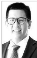
เอกนิติ นิติธรรมประกาศ

ทางออนไลน์ขายกันเต็มไหนไร้อยู่ต่อ รัฐบาลไทยกลับยังทำตัวเหมือน “นกกระจอกเทศมุดหัวในทราย” ปลอ่ยให้รายได้ภาษีสรรพสามิตก่อนมที่มาละลายหายไปตามหน้าต่อตา แทนที่จะได้นำมาพัฒนาประเทศ! แถมยังปลอ่ยให้เกิดช่องว่างกลายเป็นแหล่งทุนทรัพย์ของ “เงินใต้โต๊ะ”... เกิดข่าวการรีดไถรายวันที่ทำลายภาพลักษณ์การท่องเที่ยวไป... แวดวงการเงิน มองว่าสาเหตุที่ภาครัฐยังไม่กล้าขยับเข้ามาแบ่งส่วนหนึ่งก็เพราะติดหล่ม “ความกลัว” จากแรงกดดันของหน่วยงานสายอนุรักษ์นิยมและกลุ่มเอ็นจีโอด้านสุขภาพ เคยเลือกที่จะกอดป้ายคำว่า “แบน” เอาไว้ ทั้งๆ ที่ในความเป็นจริงมันล้มเหลวโดยสิ้นเชิง...!! ซึง้อเอาไว้แบบนี้ คนที่ช่วยที่สุดก็คือ สังคมและเยาวชนนั่นแหละครับ! เพราะพอปลอ่ยให้มันเป็นของใต้ดิน รัฐบาลไม่มีอำนาจเข้าไปจัดระเบียบควบคุมอายุผู้ซื้อก็ไม่ได้ มาตราฐานความปลอดภัยของสารเคมีในตัวยาก็ไม่มี แถมยังปลอ่ยให้เด็กๆ เข้าถึงได้ง่ายกว่าเดิมเสียอีก...ทั้งๆ ที่หน่วยงานฝั่งเศรษฐกิจก็รู้เต็มอกว่า การเปลี่ยนจาก “การแบนที่ไร้ผล” มาเป็น “การควบคุมด้วยกฎหมาย” (Regulation) เหมือนอย่างที่ประเทศเจริญแล้วกว่า 80 ประเทศเขาทำกัน มันคือทางออกเดียวที่สะเด็ดน้ำที่สุด ทั้งได้กำไรเข้ารัฐ ทั้งจำกัดพื้นที่การขายเพื่อปกป้องเด็กได้อย่างจริงจัง... การบริหารประเทศในยุคที่โลกเปลี่ยนผ่านด้วยเทคโนโลยี จะมารัวอ้างเหตุผลแบบโลกสวยแล้วปลอ่ยให้ปัญหาหมันหมักหมมอยู่ที่ท่ามแบบนี้ บอกเลยว่าด้านกระแสสังคมไม่อยู่หรอกครับ...ถึงเวลาที่รัฐบาลต้องเลิกหลบหลังความกลัว แล้วหันมาเผชิญหน้าจัดการกับความจริงได้แล้ว... เอาจริงๆ นะ...คุณเอกนิติ นิติธรรมประกาศ รองนายกรัฐมนตรีและรัฐมนตรีว่าการกระทรวงการคลัง...รู้เรื่องนี้ดีที่สั่งตั้งแต่ตอนเป็นอธิบดีกรมสรรพสามิตแล้วครับ...■ ■