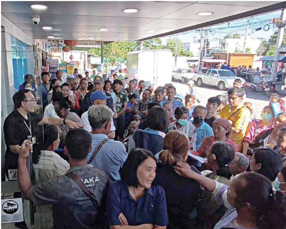
▲ เหมือนเดิม...ประชาชนจำนวนมากมาให้เจ้าหน้าที่ธนาคารกรุงไทย ช่วยยืนยันตัวตนลงทะเบียนไทยช่วยไทยพลัส เป็นวันที่ 3 แต่บรรยากาศยังคงโกลาหล ที่ธนาคารกรุงไทย สาขาหนองจอก จ.อุทัยธานี

โครงการไทยช่วยไทย พลัส 60/40 ฉลุย “ปลัดคลัง” เผยตรวจสอบสิทธิรายใหม่เสร็จแล้วกว่า 6 ล้านราย พร้อมอัปเดต ◆อ่านต่อหน้า 10