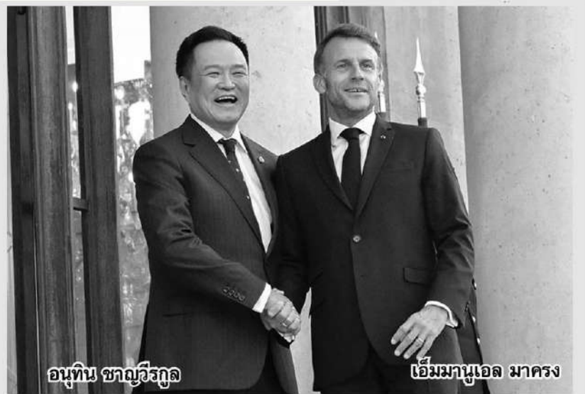
อนุทิน ชาญวีรกุล

4.สถานการณ์ไทย-กัมพูชา และเมียนมา นายกรัฐมนตรียืนยันไทยยึดมั่นเคารพในหลักอธิปไตยสันติภาพ และกฎหมายสากล การตัดสินใจยกเลิก MOU 44 เนื่องจากตลอดระยะเวลาเกือบ 25 ปีไม่มีความคืบหน้า ไทยจึงเลือกที่จะใช้