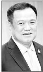
อนุทิน ชาญวีรกูล

เริ่มแรกสมัยรัฐบาลพลเอกประยุทธ์ จันทร์โอชา ในปี 2560... มีคนได้สิทธิ 11.46 ล้านคน...ผ่านมาเกือบ 10 ปี ซึ่ง คุณอนุทิน ก็อยู่ร่วมบริหารประเทศมาตลอด...ปัจจุบันคนไทย ที่มีสิทธิถือ“บัตรคนจน” 13.22 ล้านคน...รัฐบาล“คนดี” ที่ ประกาศว่ารักชาติ...ตั้งแต่รัฐบาล“ลุงตู่”ถึง รัฐบาล “หนู 2” รวมก็ 5 รัฐบาลพอดี...โคตรเก่ง...เพิ่มยอด“บัตรคนจน” ได้เก่งกว่าบริษัทบัตรเครดิตเสียอีกนะ...นี่ขนาดว่ามี“คนยากจน...จนวันตาย”หายไปแล้วยอดก็ยังไม่พุ่งได้...!! สิ่งที่ยืนยันได้ว่าที่ ...แวดวงการเงิน...บอกว่ารัฐบาลไทยที่ผ่านมาโคตรเก่ง...ก็น่า จะเป็นข้อมูลจากการแถลงข่าวของ...สภาพัฒนาการเศรษฐกิจ และสังคมแห่งชาติ (สภาพัฒน์ หรือ สศช.)...แถลงข่าว เรื่อง...ภาวะสังคมไทยไตรมาส 1/2569...ที่พบว่าหนี้ครัวเรือนไตรมาส 4/2568 เพิ่มขึ้น 0.05% มีมูลค่า 16.44 ล้านล้านบาท ทำให้สัดส่วนหนี้ครัวเรือนต่อผลิตภัณฑ์มวลรวมในประเทศ (จีดีพี) อยู่ที่ 86.7% เพิ่มขึ้นจากไตรมาสก่อน...หนี้ครัวเรือนที่เกิดขึ้นส่วนหนึ่งก็ถูกมาเพื่อใช้ในชีวิตประจำวัน...นั่นแปลว่ารายได้ที่มีไม่พอกับรายจ่าย...และ สินเชื่อส่วนบุคคล (สินเชื่อที่อยู่อาศัยและสินเชื่อเนกประสงค์) ที่ผิคนัดชำระเกิน 90 วันขึ้นไป (NPLs) 1.31 ล้านล้านบาท คิดเป็น 9.59% ของสินเชื่อรวม เพิ่มขึ้นจากไตรมาสก่อน 9.45%...อีกข้อมูลที่สำคัญคือรายได้จากแรงงานที่มีเงินเดือนประจำ และ กลุ่มแรงงานอิสระ (ฟรีแลนซ์)...ก็ลดลงด้วย...!! เห็นไหมล่ะ 5 รัฐบาล“คนดี” นี้โคตรเก่งเลยนะ...■ ■ ■