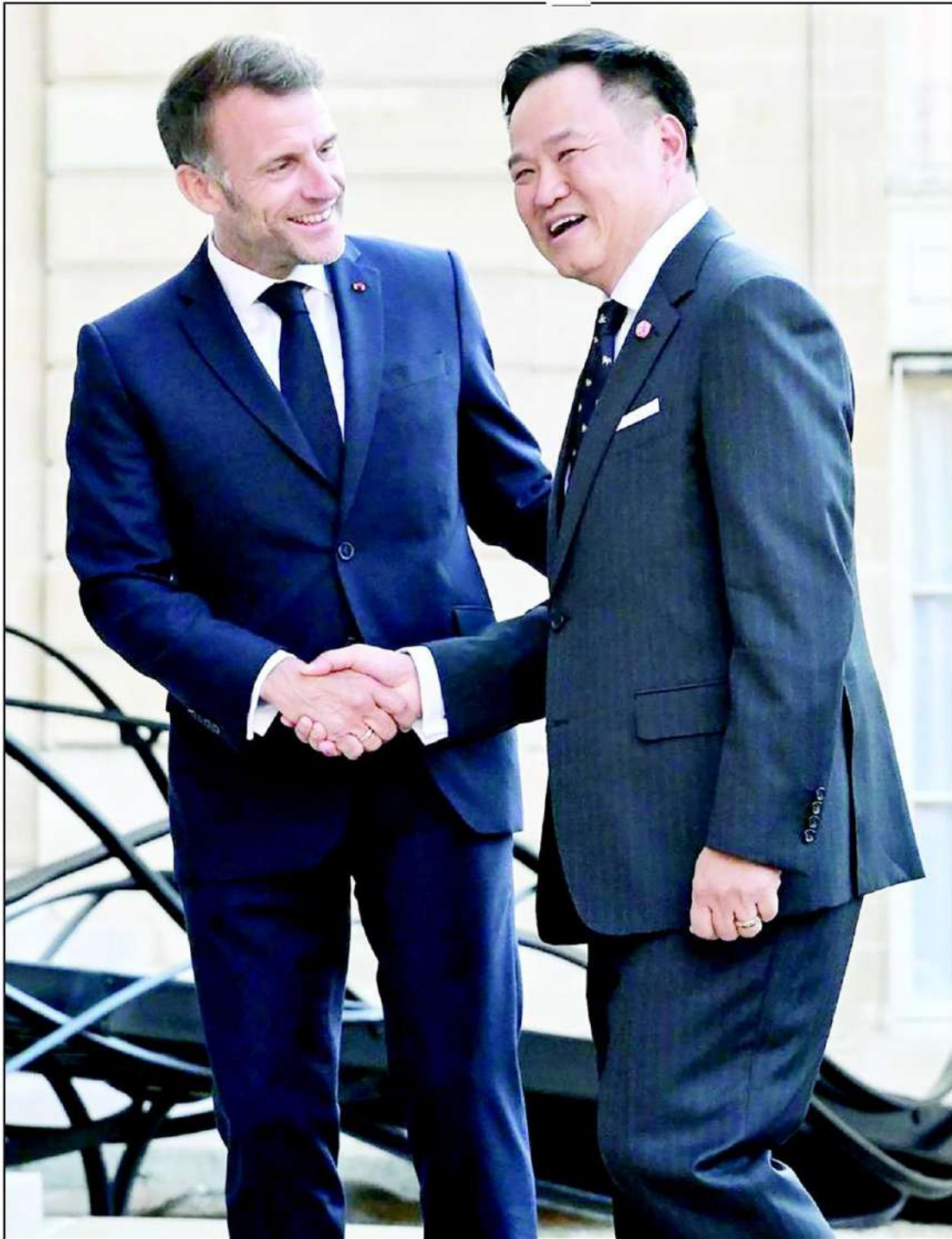
นายเอมมานูเอล มาครง ประธานาธิบดีแห่งสาธารณรัฐฝรั่งเศส เป็นเจ้าภาพเลี้ยงอาหารค่ำแก่นายอนุทิน ชาญวีรกูล นายกรัฐมนตรี ด้วยบรรยากาศการต้อนรับอย่างอบอุ่น ณ ทำเนียบประธานาธิบดีฝรั่งเศส

กรุงปารีส/กรุงเทพฯ ● นายกษ ทาเรือ ปธน. ฝรั่งเศส เดินหน้ายกระดับความสัมพันธ์สู่ หันส่วนทางยุทธศาสตร์ ขยายความร่วมมือ เศรษฐกิจ-ความมั่นคง พร้อมผลักดัน FTA ไทย-เวียดนามฝรั่งเศสสัมฤทธิ์ผล "มาครง" ให้เกียรติ ไทย ปลื้มนักลงทุนมาไทยเพราะความพร้อม สมบูรณ์ไม่ใช้ค่าแรงถูก ลั่นรัฐบาลชุดนี้ไม่