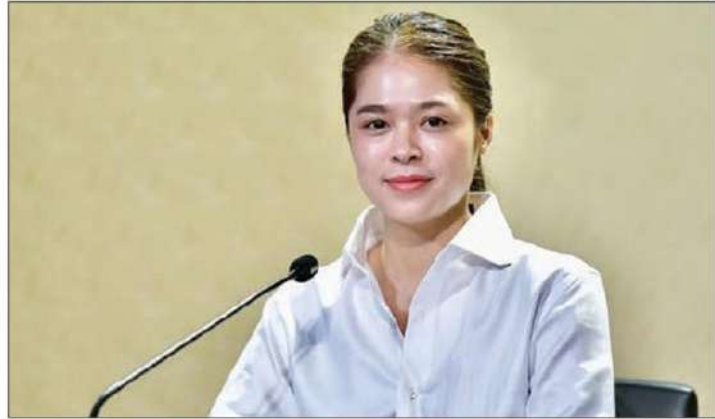
พลอยทะเล ลักขมีแสงจันทร์

โดยให้ส่วนราชการ รัฐวิสาหกิจ และหน่วยงานของรัฐ ถือปฏิบัติตามแนวทางการใช้ประโยชน์ที่ราชพัสดุ เพื่อติดตั้งเครื่องอัดประจุไฟฟ้า/สถานีบริการอัดประจุไฟฟ้า สำหรับยานพาหนะไฟฟ้า สำหรับส่วนราชการ/อปท. ที่เป็นผู้ใช้ที่ราชพัสดุ หรือผู้ครอบครองใช้ประโยชน์ที่ราชพัสดุ ที่กรมธนารักษ์ได้กำหนด