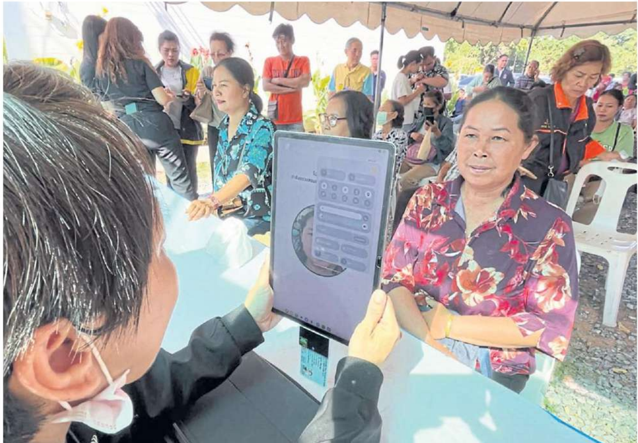
People gather at Krungthai Bank in Sikhiu district, Nakhon Ratchasima, on the opening day of registration Monday for the co-payment scheme.

Regarding the 60/40 scheme, Mr Lavaron said eligibility is capped at 30 million people, which should be sufficient for all Thais 18 and older who are not state welfare cardholders. This estimate is based on the previous co-payment scheme, which initially capped eligibility at 20 million people, but eventually recorded registrations exceeding the quota by 6 million.