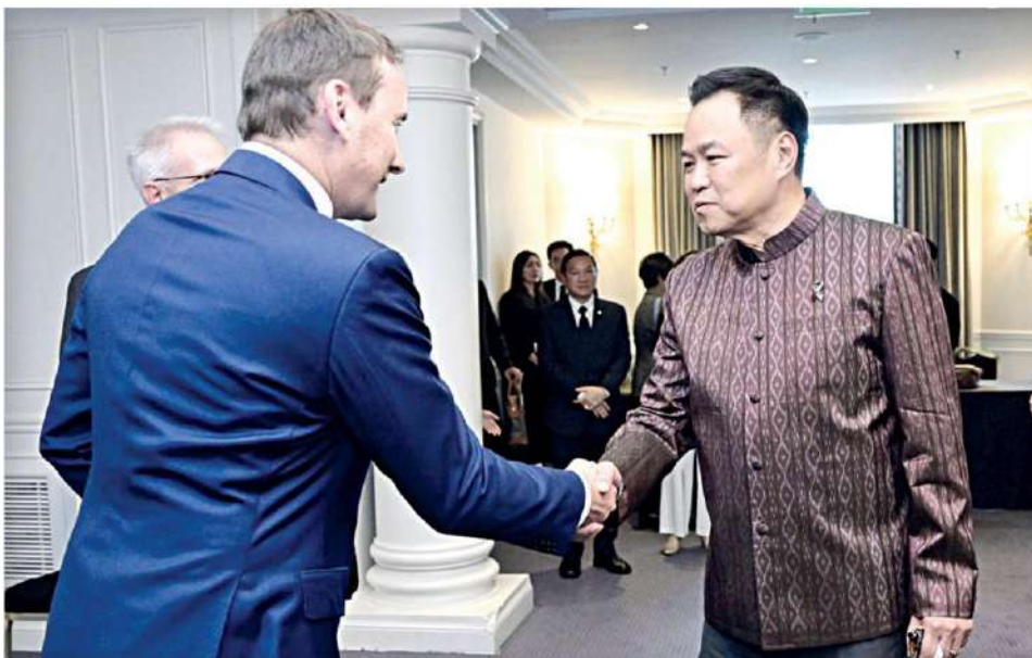
▲ ปิดดีลเอกชน...นายอนุทิน ชาญวีรกูล นายกรัฐมนตรี และรมว.มหาดไทย พบปะผู้บริหารบริษัทเอกชน ไทยที่ลงทุนในประเทศฝรั่งเศส เพื่อหารือส่งเสริมความร่วมมือทางเศรษฐกิจไทย-ฝรั่งเศส ในหลากหลายมิติ