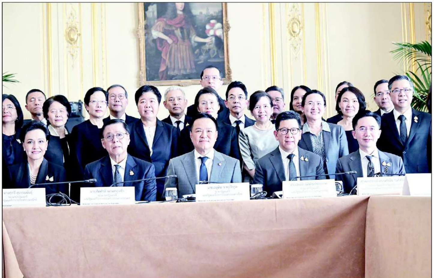
นายอนุทิน ชาญวีรกูล นายกรัฐมนตรีและรัฐมนตรีว่าการกระทรวงมหาดไทย พร้อมคณะ เข้าร่วมการประชุมเอกอัครราชทูต/กงสุลใหญ่ ประจำภูมิภาคยุโรป ณ ห้อง Salon Foch ชั้น 1 Le Cercle de l'Union interalliée กรุงปารีส สาธารณรัฐฝรั่งเศส เมื่อวันที่ 24 พฤษภาคม 2569

โฆษกประจำสำนักนายกรัฐมนตรี เผยว่า ภาคเอกชนมีข้อเสนอต่อภาครัฐ คือ 1.สนับสนุนเร่งปิดการเจรจาการค้าเสรี (เอฟทีเอ) ไทย-สหภาพยุโรป ซึ่งจะลดอัตราภาษีที่สหภาพยุโรปเรียกเก็บจากสินค้าไทยจาก 24% ลดเหลือ 0% ทำให้สินค้าไทยมีโอกาสตีตลาด เจาะตลาดยุโรปได้มากขึ้น 2.การส่งเสริมแฟรนไชส์ ธุรกิจแบรนด์ไทยในตลาดยุโรป ผ่านมาตรการของธนาคารเพื่อการส่งออกและนำเข้าแห่งประเทศไทย (เอ็กซิมแบงก์) โดยเฉพาะธุรกิจร้านอาหาร ซึ่งอาหารไทยเป็นที่ชื่นชอบของนานาชาติ แต่สิ่งที่ยังขาดคือ ร้านอาหารไทยหลายร้านดำเนินการโดย