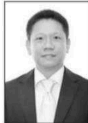
หลวง แสงสนิท

รองนายกรัฐมนตรีและรัฐมนตรีว่าการ กระทรวงการคลัง...เดอะบ๊อด...หลวง แสงสนิท ปลัดกระทรวงการคลัง... ไม่ได้แสดงอาการโมโหโกรธาใดๆ ออกมาให้สังคมได้เห็นจนทำให้สังคม อาจตำหนิได้เรื่องวุฒิภาวะของผู้บริหาร ระดับสูง...ส่วนของผู้บริหารของทั้ง 3 กรมจัดเก็บภาษี...ก็แสดงท่าทีได้ ยอดเยี่ยม...แทนที่จะโยนขวายเรียกร้องหา หลักฐานหรือออกมาแฉ...แต่กลับเลือก