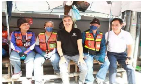
Abhisit Vejjajiva, leader of the opposition Democrat Party, centre, and Anucha Ruangsakdi, the party's Bangkok governor candidate, right, sit with motorcycle taxi riders during a field inspection in Sukhumvit Soi 4 on Saturday.

The government's 400-billion-baht borrowing plan and Land Bridge megaproject could place long-term financial burdens on the public, says Abhisit Vejjajiva, leader of the opposition Democrat Party.