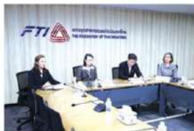
'ดัชนีอุตสาหกรรม' เม.ย. ดิ่ง