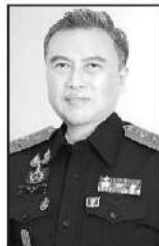
ดร.พรชัย ฐีระเวช

ประเมินสภาพรถและราคามาตรฐานเลย แล้วการรับเทรดรถเก่าจะเอาไปทำอะไร หากไม่มีที่รับซื้อก็ต้องทำลายโครงรถ และเครื่องยนต์เก่า เผลอๆ การทำลายจะสร้างคาร์บอนฟุตพริ้นท์มากกว่าจะช่วยโลก... ฝ่ายใหญ่อยากจะเป็นเจ้าภาพโอลิมปิกการเงินการคลังโลก แต่ในประเทศใครเชื่อมั่นในทีมเศรษฐกิจบ้างหรือยังต้องถามใจ ดร.เอกนิติ นิติทัณฑ์ประภาศ รองนายกรัฐมนตรีและรัฐมนตรีว่าการกระทรวงการคลัง... ว่าตอนนี้ที่ท่ายูเอ็มเอ็นถูกต้องไหม??? อะไรที่สำคัญกับการจัดเก็บภาษีให้มีประสิทธิภาพ มีการศึกษาไว้แล้วไม่เคยคิดจะใส่ใจ... เรื่องเดิมๆ อย่างการปรับโครงสร้างภาษีหุ้นที่... แวดวงการเงิน... ย้ำนักย้ำหนาตลอดเมื่อไหร่จะหยิบขึ้นมาทำ... แต่กลับดึงเรื่องที่ไม่เกี่ยวกับหน้าที่กรมสรรพสามิตโดยตรงและไม่เคยได้ทำการศึกษาไว้ก่อนมาป่าวประกาศให้ผู้บริโภคและค่ายรถยนต์ ดิ้นตระหนก ทั้งๆ ที่มาตรการยังไม่สะเด็ดน้ำ ซึ่งคนที่ได้ประโยชน์สูงสุดคงไม่ใช่ใครที่ไหนแต่เป็น “ค่ายรถอวี” จากจีน... ซึ่งตอนนี้มีสัญญาณ ที่ไม่สู้ดีว่าวันหนึ่ง “ไทยจะโดนเท”... เรื่องที่ฝันไว้ว่ามาตรการ EV 3.5 จะสร้างโอกาสปลดล็อกศักยภาพสายการผลิตอวีไทย สร้างงาน สร้างอาชีพ แบบที่หวังไว้... อาจจะไม่ได้ตามหวัง... เรื่องเล็กๆ อย่างการปรับโครงสร้างภาษีหุ้นที่... ทั้ง IMF และ World Bank นักวิชาการทั่วประเทศต่างให้ความเห็นตรงกันว่าควรปรับให้เป็นโครงสร้างแบบอัตราเดียว ยังดูมองข้าม... อยากให้ ดร.เอกนิติ นิติทัณฑ์ประภาศ และ ดร.พรชัย ฐีระเวช อธิบดีกรมสรรพสามิต... เร่งดำเนินการให้เสร็จหลังจากที่เคยประกาศโครมครมว่าจะทำตั้งแต่ “รัฐบาลอนุทิน 1” ปัจจุบันรัฐบาลก็เริ่มทำงานจะสองเดือนแล้ว ไม่รู้จะรอให้ยุบสภาอีกรอบหรือค่อยคิดเสนอเรื่องนี้...■■■