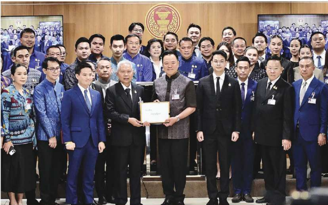
🏠 พรรคแรก - นายอนุทิน ชาญวีรกูล นายกฯ และหัวหน้าพรรคภูมิใจไทย นำทีม สส. ของพรรค ยื่นร่างแก้ไขรัฐธรรมนูญ เป็นพรรคแรกต่อ นายโสภณ ชวรัมย์ ประธานสภาผู้แทนราษฎร ยืนยันมีความจริงใจและฟังเสียงของประชาชนในการแก้ไขให้เป็น ประชาธิปไตยมากขึ้น ที่รัฐสภา เมื่อวันที่ 20 พ.ค.

‘อนุทิน’ นำ สส. ภูมิใจ ไทยยื่นร่างแก้ไข รธน. ต่อประธานสภา คุยเป็น พรรคแรก พิสูจน์ความ จริงใจ □ อ่านต่อหน้า 10