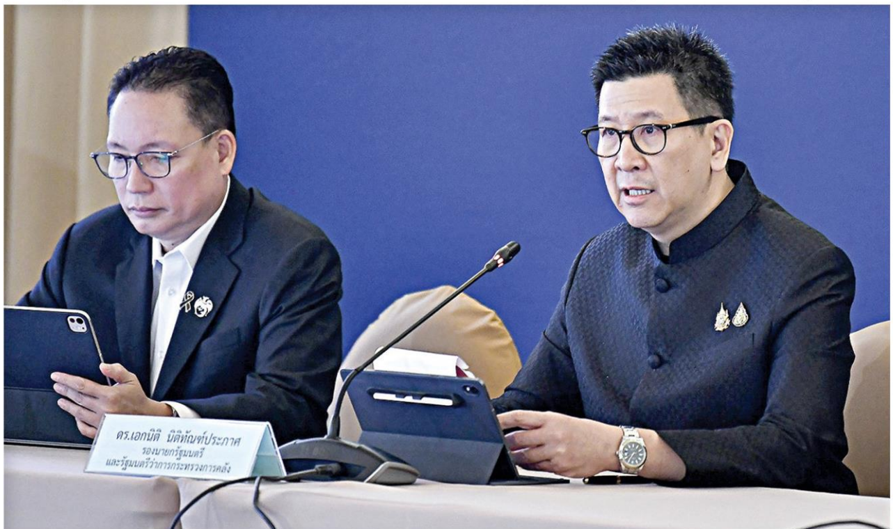
▲ ผ่านฉลุย...นายเอกนิติ นิติทัณฑ์ประภาศ รองนายกฯ และ รมว.คลัง แถลง กรม.ไฟเขียวไทยช่วยไทยพลัส เพื่อบรรเทาภาระค่าครองชีพประชาชน โดยให้สิทธิกว่า 43 ล้านคน เป็นกลุ่มบัตรสวัสดิการแห่งรัฐ 13.18 ล้านคน และกลุ่มคนทั่วไปรับสิทธิ 60/40 จำนวน 30 ล้านคน

เกิน 4 แสนล้านบาท แบ่งเป็น กลุ่มบัตรสวัสดิการแห่งรัฐ จำนวน 13.18 ล้านคน และกลุ่มที่ไม่มีบัตรสวัสดิการแห่งรัฐ เป็นกลุ่มคนทั่วไป รับสิทธิ 60/40 จำนวน 30 ล้านคน จะได้รับเงินช่วยเหลือเดือนละ 1,000 บาท นาน 4 เดือน ตั้งแต่วันที่ 1 มิ.ย.-30 ก.ย.69 โดยเปิดลงทะเบียนผ่านแอปพลิเคชันเป่าตั้งสำหรับมาตรการ 60/40 ในวันที่ 25-29 พ.ค.นี้ เวลา 08.00-22.00 น. ส่วนบัตรสวัสดิการแห่งรัฐรับสิทธิทันที ไม่ต้องลงทะเบียนใหม่ ทั้งนี้ปัจจุบันประเทศไทยและทั่วโลกกำลังเผชิญกับวิกฤติเศรษฐกิจที่ต่อ