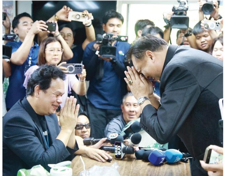
ขอโทษ - นายสุชาติ ชมกลิ่น รัฐมนตรีว่าการกระทรวงพาณิชย์ ไหว้ขอโทษ นักข่าว หลังเกิดการปะทะคารมกัน กรณีถูกจับให้ตรวจสอบกรมควบคุม มลพิษ ที่ติดอันดับสูงสุดในโพลสำรวจหน่วยงานรัฐรับสินบน ที่ทำเนียบ รัฐบาล เมื่อวันที่ 19 พ.ค.

กระทรวงคลังตั้งโต๊ะแถลงมติ ครม. อนุมัติ 'ไทยช่วยไทยพลัส ฝ่าวิกฤตไปด้วยกัน' วงเงินรวม 1.76 แสนล้าน □ อ่านต่อหน้า 10