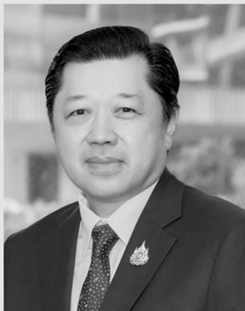
ศุภชัย เจียรวนนท์

อย่างไรก็ตาม รองนายกรัฐมนตรีประเมินว่า ตัวเลขจีดีพีที่เติบโตในไตรมาส 1 เป็นเพียงภาพสะท้อนจาก “กระจุกหลัง” เพราะเมื่อมองไปที่ถนนข้างหน้า เศรษฐกิจไทยยังคงมีความขรุขระและมีความท้าทายรออยู่ ตัวเลขเศรษฐกิจในไตรมาสแรกยังไม่ได้สะท้อนผลกระทบจากสงครามที่ปะทุขึ้นในช่วงเดือนมีนาคมอย่างเต็มที่ เนื่องจากรัฐบาลได้เข้าตรึงราคาน้ำมันดีเซลไว้ไม่ให้เกิน 30 บาทต่อลิตรในขณะนั้น