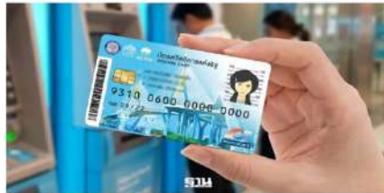
บัตรสวัสดิการแห่งรัฐรอบใหม่ 43 ล้านคน แบ่งเป็นบัตรสวัสดิการแห่งรัฐ 13.22 ล้านคน

คุณสมบัติเบื้องต้นผู้ได้รับสิทธิ์บัตรสวัสดิการแห่งรัฐรอบใหม่ คลัง กำหนดคุณสมบัติคนลงทะเบียนวันที่ 25 พ.ค.69 ดังนี้