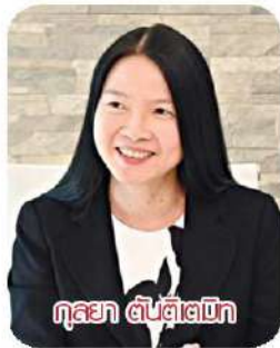
กุลยา ตันติเตมิท

น.ส.กุลยา ตันติเตมิท อธิบดีกรมสรรพากรเปิดเผยว่าได้ตัดสินใจยื่นหนังสือลาออกจากตำแหน่งข้าราชการและทุกตำแหน่งในบอร์ด ได้แก่ บมจ. การบินไทย, บมจ.เอสซีบี เอกซ์ และธนาคารไทยพาณิชย์มีผลตั้งแต่วันที่ 1 พ.ค.นี้เป็นต้นไป เพื่อต้องการพักผ่อนหลังจากทุ่มเททำงานหนักมาเป็นเวลานาน ถือเป็นทางเลือกก่อนกำหนด ในขณะที่มีอายุ 54 ปี ซึ่งชีวิตยังมีแง่มุมอื่นให้ทำอีกหลายอย่างและต้องการใช้เวลาพักผ่อนก่อนที่จะเริ่มรับงานใหม่ ๆ