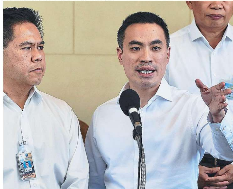
▲อัตราใหม่ นายเอกนัฏ พร้อมพันธุ์ รมว.พลังงาน และนายวราวุธ ศิลปอาชา รมว.อุตสาหกรรม ร่วมแถลงหลังการประชุม กพช. ให้ความเห็นชอบอัตราค่าไฟฟ้าแบบก้าวหน้า (Progressive Rate) ส่งเสริมให้เกิดการใช้ไฟฟ้าประหยัดเพิ่มขึ้น.

จาก 90 เมกะวัตต์ เป็น 500 เมกะวัตต์ ไม่จำกัด ลดขั้นตอนอนุมัติฉบับใน 7 วัน “วราวุธ” ยันไม่กระทบ ภาคอุตสาหกรรม ชูบ้านที่ดัดแปลงเป็นร้านค้าแฟ ไปจดทะเบียนผู้ใช้ไฟฟ้าให้ถูกต้อง อาจเสียประโยชน์ มาตรการช่วยลดภาระค่าไฟฟ้าประชาชน