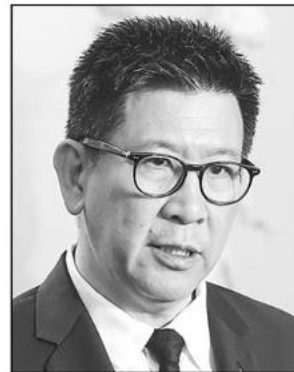
เอกนิตย นิตยพัทธ์ประภาส

"ไทยจะมุ่งผลักดันความร่วมมือระหว่างประเทศด้านการ จัดซื้อจัดจ้างมากขึ้น ทั้งในด้าน มาตรฐาน ความโปร่งใส และการ แลกเปลี่ยนองค์ความรู้ เพื่อยก ระดับการจัดซื้อจัดจ้างภาครัฐให้ เป็นกลไกสำคัญในการขับเคลื่อน