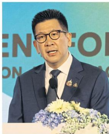
Mr Ekniti said Thailand's public procurement system plays a key role in shaping national development strategies.

He also stated that digital systems will be increasingly adopted in procurement processes to improve transparency and speed. In addition, the department will make more of its data publicly accessible to further enhance transparency in