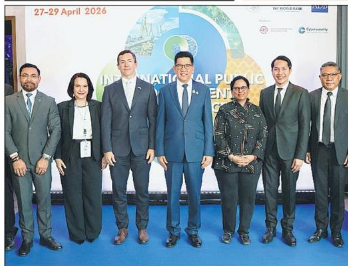
ระดมสมอง : เอกนิต นิติศัพท์ประกาศ รองนายกรัฐมนตรี และ มว.คลังประธานเปิดการประชุม International Public Procurement Conference 2026 (IPPC 2026) เพื่อระดมสมองของผู้นำด้านนโยบาย การจัดซื้อจัดจ้างในภูมิภาคเอเชียตะวันออกเฉียงใต้และแปซิฟิก ยกกระดับบทบาท การจัดซื้อจัดจ้างภาครัฐ ณ รร.มิลเลนเนียม ฮิลตัน กรุงเทพฯ เมื่อวันก่อน.