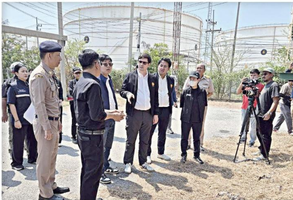
▲ ไม่ผ่านเกณฑ์...จนท.และ สส.พรรคประชาชน ลงพื้นที่ตรวจคลังน้ำมัน จ.เพชรบุรี โดยพบโรงกลั่นที่หยุดกิจการของ บ.สยามกัลป์ปิโตรเคมีคัล จำกัด มีน้ำมันตักถังในถังเก็บสูงถึง 5.6 ล้านลิตร ไม่ผ่านเกณฑ์มาตรฐาน