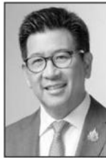
เอกนิติ นิติทัณฑ์ประภาศ

■ ■ ■ เป็นที่แน่ชัดว่าโครงการ “ถนนเครื่องพลัส” กำลังจะแปลงร่างเป็น “ไทยช่วยไทยพลัส”... น่าจะได้ใช้กันเดือนมิถุนายนนี้...คอนนี้ขอเช่าให้ตกผลึกในรายละเอียดเรื่องเงื่อนไขต่างๆ... เบื้องต้นที่มักจะบอกได้คือจะได้คนละ 4 พันบาท... ส่วนผลงานชิ้นต่อไปของหัวทีมเศรษฐกิจของรัฐบาลอย่าง...ดร.เอกนิติ นิติทัณฑ์ประภาศ รองนายกรัฐมนตรีและรัฐมนตรีว่าการกระทรวงการคลัง...น่าจะเป็นโครงการที่พุ่งเป้าไปช่วยอุตสาหกรรมยานยนต์ โดยเฉพาะรถยนต์ไฟฟ้า (EV)...ด้วยโครงการ “รถเก่าแลกรถใหม่” อะไรทำนองนั้น...(ทำให้หวนคิดถึงโครงการ “รถคันแรก”) ของรัฐบาลก่อนหน้าโน้น...รูปแบบก็คือรัฐควักเงินสนับสนุนจำนวนหนึ่งเพื่อให้คนเปลี่ยนรถคันเก่ามาใช้รถ EV...เงินที่ใช้ก็เงินภาษีประชาชนนั่นแหละ...แต่ประชาชนที่เสียภาษี 4 ล้านกว่าคนไม่ได้ประโยชน์จากโครงการนี้ทุกคนนะครับ...แต่ที่ได้ไปเต็มๆ คือ ค่าขรถยนต์ EV... ซึ่งส่วนใหญ่ที่อยู่ในเมืองไทยก็คือค่าขรถจีน...ถ้ารัฐบาลบอกว่าเป้าหมายของโครงการคือ “กระตุ้นเศรษฐกิจ และสนับสนุนการใช้รถยนต์ไฟฟ้า (EV)”...ก็ต้องตอบให้ชัดว่ากระตุ้นเศรษฐกิจแบบไหน...เช่น กำหนดว่าต้องเป็นรถที่ผลิตในเมืองไทยเท่านั้น...ใช้ชิ้นส่วนประกอบในไทยเกินกว่า 70% อะไรทำนองนี้...แล้วหากว่าคนไทยหันไปใช้รถยนต์ EV