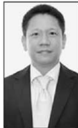
ลวรม แสงสนิท

แล้ว แต่เนื่องจากราคาน้ำมันในตลาดโลกปรับตัวลดลงมามากในช่วงนี้จึงยังไม่มีความจำเป็นที่จะต้องออกพ.ร.ก.ในส่วนนี้...จนนะ... ■ ■ ■ 4 ธนาคารรัฐ...ไม่นั่งดูขายกับวิกฤตพลังงานในรอบนี้... ต่างก็ออกมามาตรการมาช่วยเหลือครัวเรือน เกษตรกร และ SME เพื่อบรรเทาค่าใช้จ่ายด้านพลังงาน และขับเคลื่อนประเทศสู่เศรษฐกิจสีเขียว...โดย ธนาคารอาคารสงเคราะห์ (ธอส.) ออก 3 แพคเกจ “บ้านอยู่เย็นเป็นสุข” สำหรับซื้อ สร้าง หรือปรับปรุงบ้านประหยัดพลังงาน พร้อมติดตั้งพลังงานทดแทน อัตราดอกเบี้ยเริ่มต้น 2.20% ต่อปี รวมถึงสินเชื่อบ้านเบอร์ 5 ดอกเบี้ยคงที่ 2 ปีแรก 2.69% และสินเชื่อโซลาร์รูฟ วงเงินสูงสุด 300,000 บาท ดอกเบี้ยคงที่ 3 ปีแรก 3.90% โดยไม่ต้องจดจำนองเพิ่ม...ธนาคารออมสิน ออกสินเชื่อสีเขียว ครอบคลุมบ้าน รถ และธุรกิจ อาทิ GSB Green Home Loan กู้ได้สูงสุด 110% ผ่อนชำระนาน 40 ปี รวมถึงสินเชื่อ GSB Go Green สำหรับติดตั้งโซลาร์เซลล์ ชื้อรถ EV หรือเครื่องใช้ไฟฟ้าเบอร์ 5 และสินเชื่อเพื่อ SME ดอกเบี้ยเริ่มต้น MLR -0.25%...ธนาคารเพื่อการเกษตรและสหกรณ์การเกษตร (ธ.ก.ส.) สนับสนุนเกษตรกรคู่ BCG Model ผ่านสินเชื่อเครื่องจักรกล ผ่อนชำระสูงสุด 10 ปี และสินเชื่อ BCG ที่มีเงื่อนไขผ่อนปรน ชำระคืนได้สูงสุด 15 ปี พร้อมเงินทุนหมุนเวียน 12-18 เดือน...และ ธนาคารพัฒนาวิสาหกิจขนาดกลางและขนาดย่อมแห่งประเทศไทย (ธพว.) หรือ SME D Bank สนับสนุนผู้ประกอบการปรับตัวสู่ธุรกิจสีเขียว ผ่านสินเชื่อ SME Green Productivity วงเงินสูงสุด 30 ล้านบาท อัตราดอกเบี้ย 3% ผ่อนชำระนาน 10 ปี และปลอดชำระเงินต้น 12 เดือนแรก... ■ ■ ■