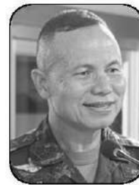
พล.ท.นริศ ไทยนอก

ล้านบาท และเพดานหนี้สาธารณะที่เหลือช่องว่างไม่มาก โดยปัจจุบันหนี้อยู่ที่ประมาณ 66% ของ GDP โกลิชนเพดาน 70% การขยับเพดานไปที่ 75% จึงเป็นทางเลือกเพื่อเปิด “พื้นที่หายใจ” ทางการคลัง ประเด็นนี้มีทั้งด้านบวกและด้านที่ต้องระวัง ด้านหนึ่ง การกู้เงินในช่วงวิกฤตถือเป็นเครื่องมือที่หลายประเทศใช้ และยังคงอยู่ในระดับที่ไม่เกินมาตรฐานสากล หากบริหารดีอาจช่วยให้เศรษฐกิจฟื้นตัวเร็วขึ้น แต่อีกด้านหนึ่ง หากใช้เงินไม่ตรงจุด หรือขาดแผนสร้างรายได้ในอนาคต ก็อาจกลายเป็นภาระหนี้ระยะยาวที่กดทับเศรษฐกิจไทย ดังนั้นคำถามสำคัญจึงไม่ใช่ “ควรกู้หรือไม่” แต่คือ “ผู้แล้วใช้ทำอะไร และคุ้มหรือไม่”