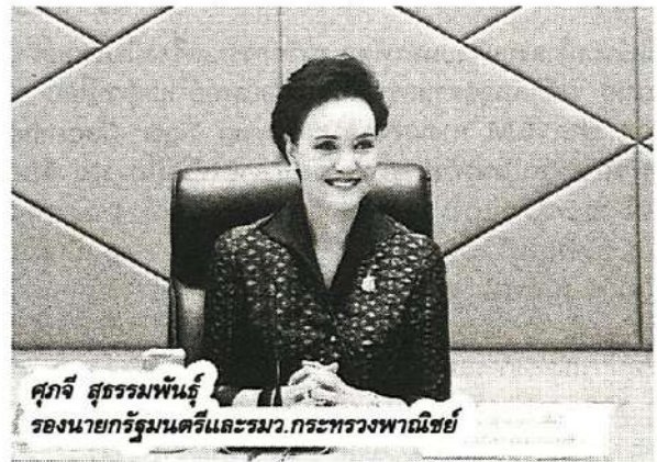
ศุภจี สุธรรมพันธุ์ รองนายกรัฐมนตรีและรมว.กระทรวงพาณิชย์

ขณะที่มีมาตรการระยะยาว (แม่ปุ๋ยคนละครึ่ง) ผ่านการร่วมมือกับกระทรวงการคลัง (ดำเนินการโดยธนาคาร