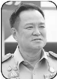
อนุทิน ชาญวีรกูล

ส ถาการณ์การคลังและการเมืองไทยในห้วงเวลานี้ กำลังเดินอยู่บน “เส้นบาง” ระหว่างความจำเป็นกับข้อจำกัดอย่างชัดเจน ภายหลังจากที่ “อนุทิน ชาญวีรกูล” นายกรัฐมนตรี และ รมว.มหาดไทย ประกาศแนวทางจัดหางบประมาณปี 2570 ด้วยคำสำคัญ “ตรงเป้า-แม่นยำ” พร้อมทั้งส่งสัญญาณถึงความเป็นไปได้ในการออกพระราชกำหนด (พ.ร.ก.) กู้เงินวงเงินระดับ “5 แสนล้านบาท” เพื่อรับมือวิกฤตซ้อนวิกฤต