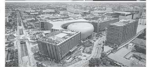
วิทยาลัยกรุงเทพ ร่วมลงนามดังกล่าว!