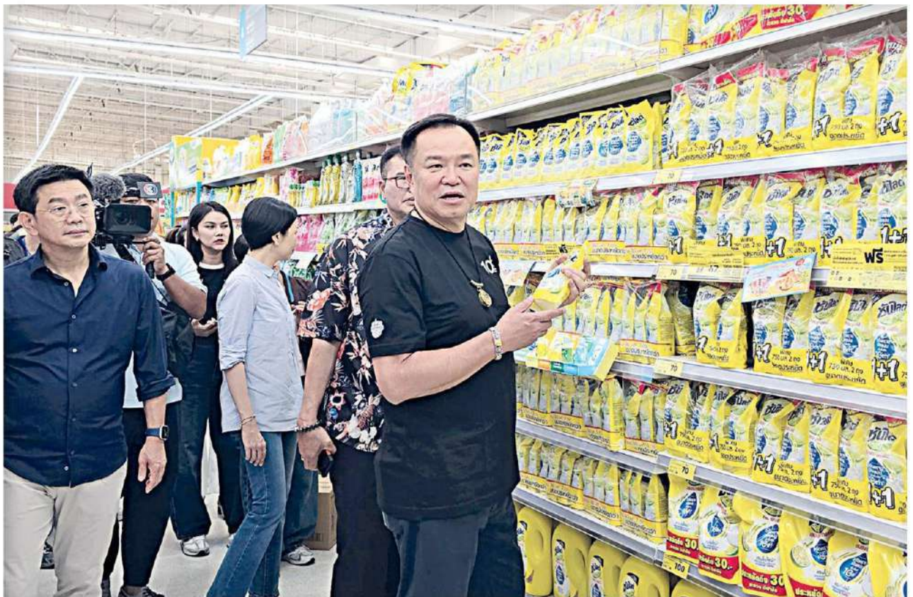
▲ไทยช่วยไทย...นายอนุทิน ชาญวีรกูล นายกรัฐมนตรีและรมว.มหาดไทย ลงพื้นที่ห้างสรรพสินค้าโลตัส สาขาบางกะปิ ตรวจสอบความคืบหน้าตามมาตรการ “ไทยช่วยไทย” ซึ่งเป็นนโยบายหลักของรัฐบาลในการช่วยเหลือประชาชนในสถานะเศรษฐกิจที่ผันผวน สิ้นค้าแพงในปัจจุบัน

จับตา! ครม.นัดพิเศษ 6 เม.ย. “เอกนิตริ” จ่อขงร้อใหญ่โครงสร้างราคาน้ำมัน-ค่าการกลั่น ลดภาระปชช. ดึงฐานข้อมูล “พีพีพี” ♦อ่านต่อหน้า 10