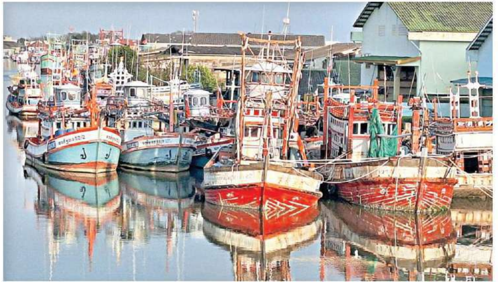
▲ พิชน้ำมัน...พิชน้ำมันแพ่งเรือประมงจำนวนมากจอดลอยลำที่ปากน้ำระยอง เนื่องจากไม่คุ้มต้นทุน ออกจับสัตว์ทะเล ภายหลังสงกรานต์มีแนวโน้มเรือประมงใน จ.ระยอง จอดเทียบท่าไม่ต่ำกว่าร้อยละ 80

ด้าน นายจุมพฏ วรรณศิริ ผวจ.สุราษฎร์ธานี ับรายงานจาก พล.ต.ต.สุวัจน์ สุขศรี ผบก.ภ.จว.สุราษฎร์ธานี ว่าเมื่อเวลา 23.30 น. วันที่ 4 เม.ย. นายกอบ ทวนคำ พาณิชย์จังหวัดสุราษฎร์ธานี ในฐานะตัวแทนผู้เสียหายเข้าแจ้งความร้องทุกข์กับพงส.สภ.เมืองสุราษฎร์ธานี ให้ดำเนินคดีกับบริษัท พี.ซี สยามปิโตรเลียม จำกัด(สำนักงานใหญ่) เลขที่