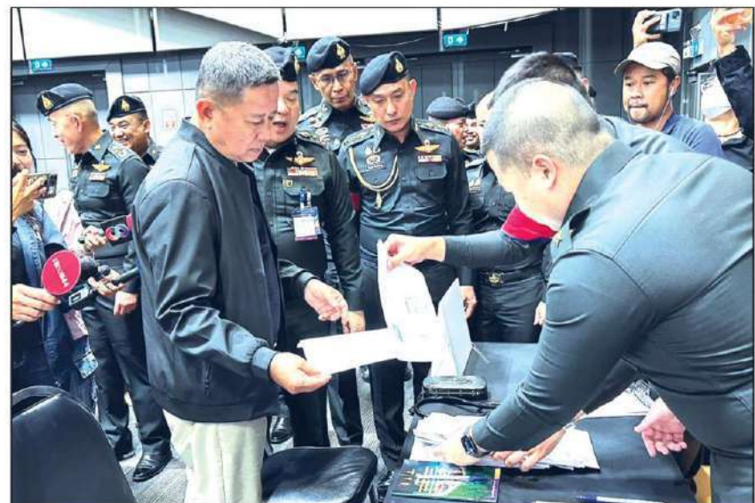
▲ ตรวจเยี่ยม : พลโทคุณย์ บุญธรรมเจริญ รมว.กลาโหม ตรวจเยี่ยมการดำเนินการ ตรวจสอบเลือกทหารกองประจำการ 2569 ที่ศูนย์การค้าเซ็นทรัลเวสต์เกต ชั้น 4 อำเภอบางใหญ่ จังหวัดนนทบุรี ทั้งให้ทหารใหม่ทุกคนมีความภูมิใจที่ได้รับใช้ชาติ

มากขึ้น นโยบายนี้ไม่เพียงมุ่งลดราคา น้ำมัน แต่ยังเป็นการแก้ไขปัญหาค่า โครงสร้าง เพื่อดูแลต้นทุนภาคขนส่ง ซึ่ง เป็นหัวใจสำคัญของเศรษฐกิจ และส่งผล โดยตรงต่อค่าครองชีพของประชาชนใน ทุกระดับ โดยที่รัฐบาลจะเร่งให้ทันกับช่วง วันหยุดยาวเทศกาลสงกรานต์นี้