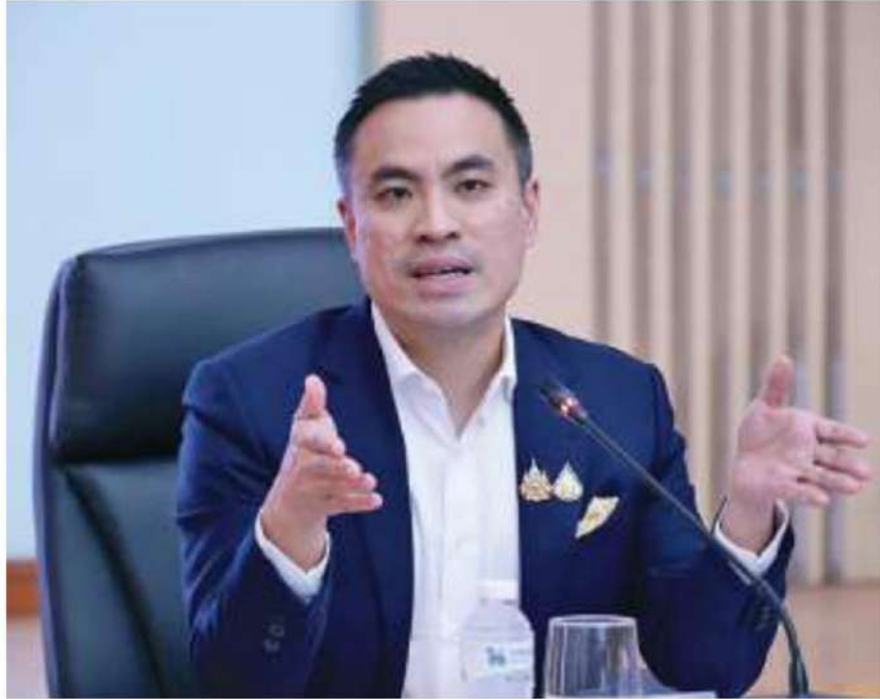
เอกนิติ พร้อมพันธ์ รัฐมนตรีว่าการกระทรวงพลังงาน

กรมธุรกิจพลังงานโซว์กราฟสวย ๆ เพื่อกลบเกลื่อนความจริงต่อไป