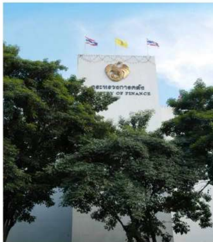
'คลัง-สภาพัฒน์' จัดมือเร่งประเมินสภาพัฒน์กับกรมบัญชีกลางจากสงครามและวิกฤตกลาง หลังเชื่อก่อนเกิน 1 เดือน เพื่อเตรียมความพร้อมมาตรการให้ความช่วยเหลือจอบด้าน ขณะที่ 4 หน่วยงานเศรษฐกิจ 'คลัง-สภาพัฒน์-สปท.-สำนักงบฯ' จ่อประชุมติดตามสถานการณ์เงินเพื่อรอบ 4 เดือน

6 เม.ย. 2569 - นายวิชาญ วัฒนสุวรรณภูมิ ผู้อำนวยการสำนักงานเศรษฐกิจการคลัง (สศค.) เปิดเผยว่า ขณะนี้กระทรวงการคลัง อยู่ระหว่างหารือร่วมกับกรมสภาพัฒนาการเศรษฐกิจและสังคมแห่งชาติ (สศช.) หรือสภาพัฒน์ เพื่อประเมินฉากทัศน์ (Scenario) ผลกระทบจากสถานการณ์ความขัดแย้งในตะวันออกกลางที่กระทบต่อเศรษฐกิจไทยในมิติต่าง ๆ และผลกระทบกับกลุ่มย่อย เพื่อใช้ในการเตรียมความพร้อมมาตรการในการให้ความช่วยเหลือต่อไป