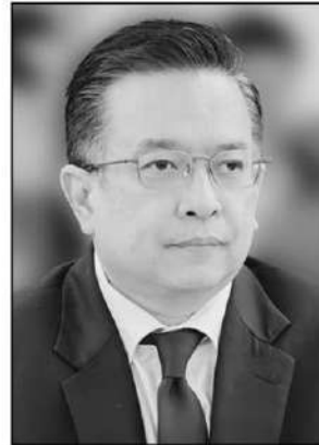
วินิจ วิเศษสุวรรณภูมิ

2569 (ต.ค.68-ก.พ.69) นั้น ผู้อำนวยการ สศค. กล่าวว่า ในภาพรวมยังเป็นไปตามเป้าหมาย โดยจากข้อมูลพบว่า รัฐบาลสามารถจัดเก็บรายได้สุทธิอยู่ที่ 1.04 ล้านล้านบาท ใกล้เคียงกับประมาณการ และสูงกว่าช่วงเดียวกันของปีก่อน 4.5% เนื่องจากการนำส่งเงินส่วนเกินจากการจำหน่ายพันธบัตรจากการกู้เงินเพื่อชดเชยการขาดดุล, การนำส่งรายได้เหลือมาจากปีก่อนของรัฐวิสาหกิจบางแห่ง และการจัดเก็บภาษีน้ำมันและผลิตภัณฑ์น้ำมัน เนื่องจาก