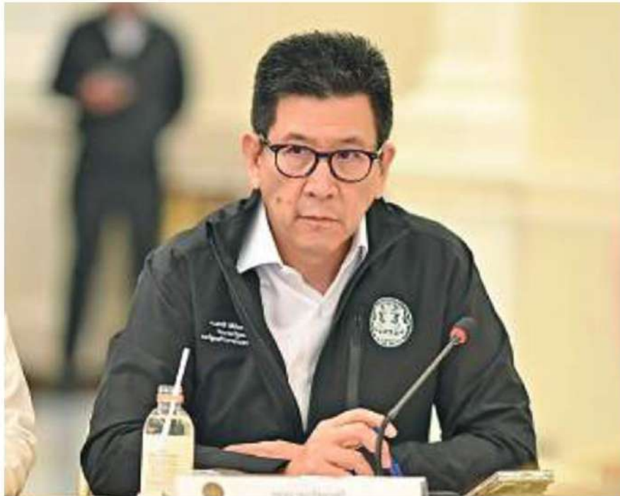
เอกนิติ นิติทัณฑ์ประภาศ รองนายกรัฐมนตรี และรัฐมนตรีว่าการกระทรวงการคลัง

ต้องแบกรับ และด้วยความที่เขาคืออดีตรัฐมนตรีพาณิชย์ จึงมีความเชี่ยวชาญด้านโครงสร้างภาษี ซึ่งเป็นกลไกสำคัญในการกตราค่าน้ำมันลงได้ทันทีหากรัฐบาลต้องการ