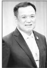
อนุทิน ชาญวีรกุล

■ ■ ■ ไม่ใช่แค่ คุณอนุทิน ชาญวีรกุล นายกรัฐมนตรี...ที่โชว์ภาพการประหยัดพลังงาน...ด้วยการเจียดเศษเงิน (ล้านกว่าบาท) ถอยรถไฟฟ้าป้ายแดงมาทำงาน...ใช้รถเข่าย่องสู่มตรวจปั๊มน้ำมัน (ใครเชื่อบ้างว่าสู่มตรวจ)...วันก่อน ดร.เอกนิติ นิติทัณฑ์ประภาศ รองนายกรัฐมนตรีและรัฐมนตรีว่าการกระทรวงการคลัง...เสร็จการแสดงปาฐกถาในงานเสวนาเวทีหนึ่งย่านกลางเมือง...และมีภารกิจในการเป็นประธานที่ประชุมร่วมกับหัวหน้าหน่วยราชการของกระทรวงการคลัง...ก็เสวนาทีมงานโคดขึ้นรถไฟฟ้า BTS แล้วมาลงที่สถานีอารีย์เพื่อรีบกลับบ้านมาประชุมที่กระทรวงฯ... นี่ย่าจะบอกกับสังคมว่าทำไปเพื่อเป็นการเชิญชวนให้ประชาชนหันมาใช้ระบบขนส่งสาธารณะกันเยอะๆ เพื่อร่วมกันประหยัดการใช้น้ำมันจากการขับรถยนต์ส่วนตัว (แต่ที่ต้องลงสถานีนั้นเพราะใกล้กับกระทรวงฯที่สุด และรถไฟฟ้า BTS ยังไปไม่ถึงกระทรวงฯ)...ว่าแต่พวกเขาจะได้เห็นแบบนี้บ่อยๆ ไหม...รัฐมนตรีทุกท่านในรัฐบาลจะหันมาใช้บริการรถสาธารณะมากขึ้นแค่ไหน...และ...แวดวงการเงิน...มั่นใจว่าประชาชนคนไทยทั่วประเทศ...กำลังคาดหวังในตัว ดร.เอกนิติ...มากที่สุดในฐานะ ประธานคณะกรรมการศึกษาความเหมาะสมในการกำหนดต้นทุนราคาน้ำมันเชื้อเพลิง (ลดตร.) คือ...แนวทางที่เหมาะสมในการกำหนดค่าการกลั่น