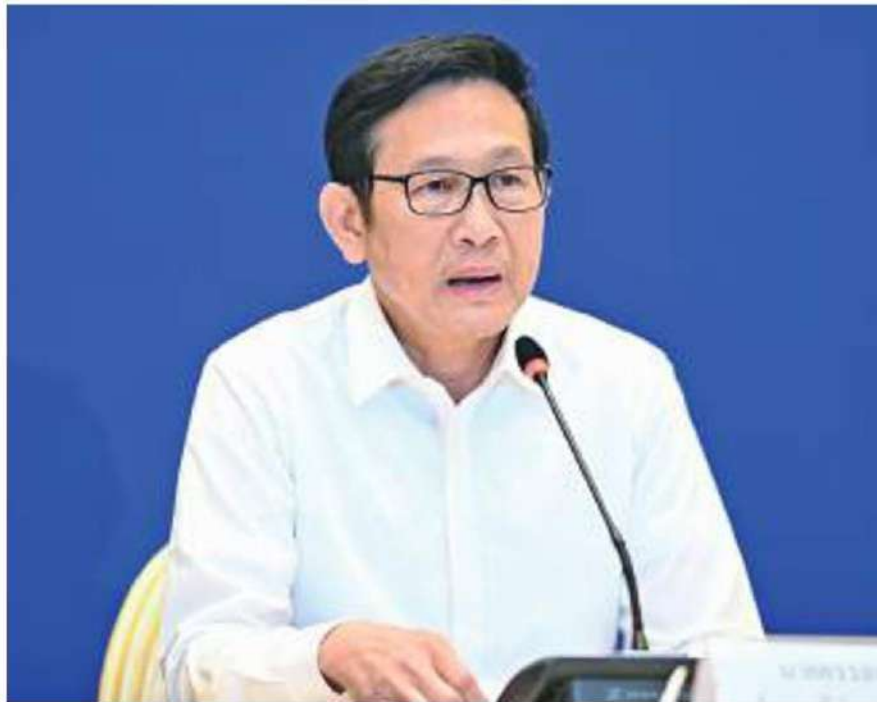
อรรถพล ฤกษ์พิบูลย์ อดีตรัฐมนตรีว่าการกระทรวงพลังงาน ที่ได้รับการแต่งตั้งเป็นหนึ่งในคณะกรรมการศึกษาความเหมาะสมในการกำหนดต้นทุนราคาน้ำมันเชื้อเพลิง (ศตร.)