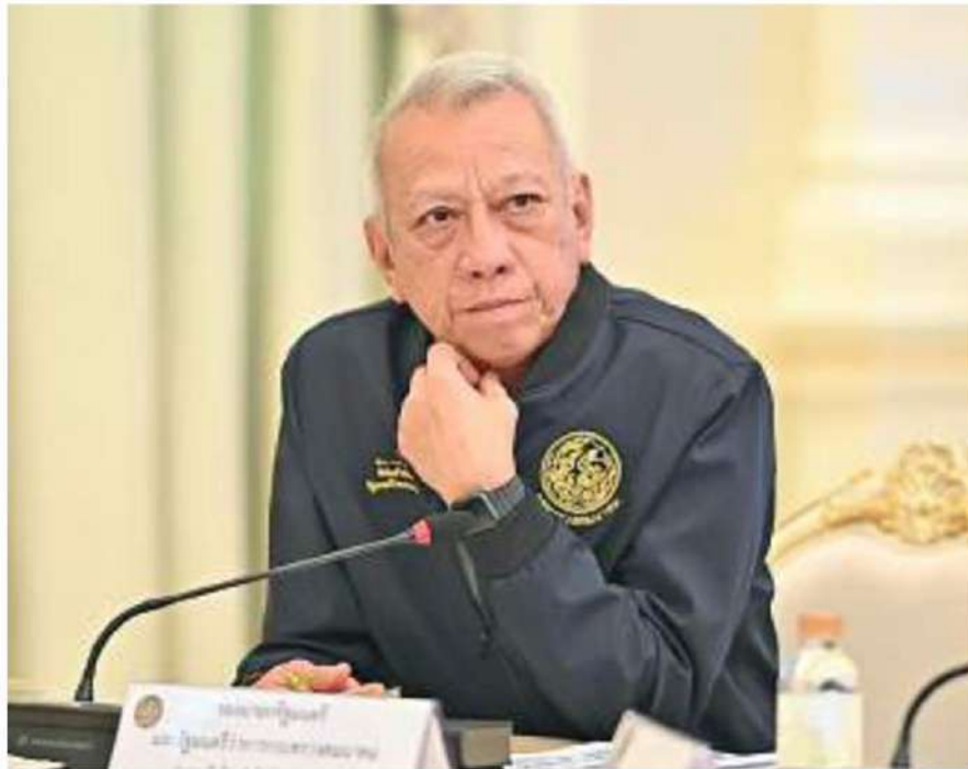
พิพัฒนา รัชกิจประการ รองนายกรัฐมนตรี และรัฐมนตรีว่าการกระทรวงคมนาคม

เอกนิติ นิติทัณฑ์ประภาศ รองนายกรัฐมนตรี และรัฐมนตรีว่าการกระทรวงการคลัง มาทำหน้าที่แทน