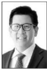
ดร.เอกนิติ นิติทัณฑ์ประภาศ

■■ เรากำลังเห็นเงาของมาตรการที่รัฐบาลจะใช้บรรเทาความเดือดร้อนของพี่น้องประชาชนจากปัญหาวิกฤตพลังงาน...ที่ ดร.เอกนิติ นิติทัณฑ์ประภาศ รองนายกรัฐมนตรีและรัฐมนตรีว่าการกระทรวงการคลัง...จะนำเสนอต่อที่ประชุมคณะรัฐมนตรี (ครม.) นัดแรกในวันที่ 6 เมษายน 2569 นี้แล้วว่าเป็นอย่างไรบ้าง...เช่น การช่วยเหลือผ่านโครงการ “คนละครึ่ง พลัส”...บัตรสวัสดิการแห่งรัฐ...ช่วยวินมอเตอร์ไซค์รับจ้าง...ดูแลค่าขนส่งสินค้าอุปโภค-บริโภค...ช่วยเรื่องปุ๋ยเคมีให้เกษตรกร... ฯลฯ...แต่ยังต้องจับตาดูว่าสำหรับภาคธุรกิจที่ต้องแบกรับ “ต้นทุน” ที่พุ่งสูงขึ้น ทั้งต้นทุนพลังงาน...ต้นทุนวัตถุดิบ... ฯลฯ จะออกมาพร้อมกันด้วยหรือไม่...เพราะตอนนี้เกือบจะทุกธุรกิจได้รับผลกระทบหนักเหมือนกันหมด...และที่หนักกว่าใครเพื่อน เช่น อุตสาหกรรมปิโตรเคมีและพลาสติก...ภาคเกษตร...ขนส่งและโลจิสติกส์...การผลิตอุตสาหกรรมหนักและการส่งออก...ที่น่าสนใจคือ 5 อุตสาหกรรมข้างต้นนั้นเกี่ยวข้องกับภาระงานจำนวนมาก...หากอุตสาหกรรมเหล่านี้ไปไม่รอดหรืออยู่ลำบากมากขึ้น...ย่อมกระทบกับการจ้างงาน...และนั่นเท่ากับว่าภาคประชาชนหรือภาคครัวเรือน