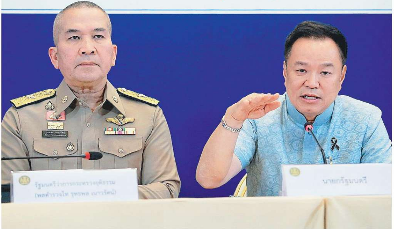
▲ ลักลอบส่งออก นายอนุทิน ชาญวีรกูล นายกช นำแกลง ศบก.ชี้แจงผลการปราบปรามขบวนการกักตุนน้ำมัน แคมป์ไอ้โม่กักตุน ลักลอบส่งออก และประวิงเวลาลอยเรือกลางทะเลรอน้ำมันปรับราคา ลั่นไม่สนใจพบใครทำผิดจับหมด ส่งดีเอสไอฟันเป็นคดีพิเศษ พร้อมยืนยันสงกรานต์น้ำมันเต็มปั๊ม.