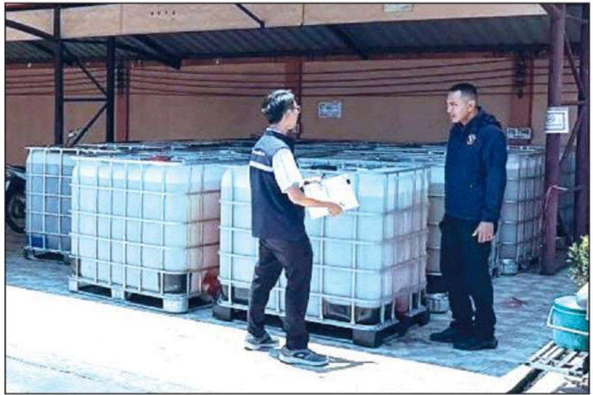
▲ น้ำมันเดือน : เจ้าหน้าที่ศุลกากร สรรพสามิต และตำรวจชุดปราบปรามการกระทำผิดเกี่ยวกับ น้ำมันเชื้อเพลิง เข้าใจโจมตตรวจสอบคลังน้ำมันเดือน ซึ่งเป็นกลุ่มทุนชาวจีนมาเลเซียในพื้นที่ อำเภอสระตะกอย จังหวัดสงขลา ยึดน้ำมันดีเซลที่เตรียมส่งไปขายพื้นที่มาเลเซีย กว่า 1 แสนลิตร

แหล่งข่าว เปิดเผยด้วยว่า ข้อมูล ที่นายพิพัฒน์ทำไว้ ได้ถูกนายเอกนิติ นำมาขยายผลต่อยอด สั่งการให้กระทรวง พลังงานพิจารณา “ตัดต้นทุนส่วนเกิน” ออกจากราคาขายส่งหน้าโรงกลั่น พร้อม ทบทวนความจำเป็นของ War Premium เพื่อสะท้อนราคาที่เป็นธรรมและโปร่งใส