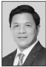
วิทย์ รัตนากร

จะโดนกระแทกจากพายุ 2 ลูกซ้อน...ลูกที่ 1 รายได้ที่ต่ำอยู่แล้วจนไม่พอจะจับจ่ายในยุคที่สินค้าและบริการแพงขึ้นตามราคาน้ำมัน ลูกที่ 2 เมื่อกิจการที่ตัวเองทำงานอยู่ไม่รอดก็ต้องตกงาน จากที่มีรายได้ต่ำอยู่แล้ว ก็จะกลายเป็นว่าไม่มีรายได้เลย...!! อันนี้อันตรายต่อสังคมไทยมาก ๆ เพราะเมื่อประชาชนไม่มีทางไปแต่ต้องเอาชีวิตของตนและครอบครัวให้รอด...อาจจะเลือกทางเดินผิด...และนั่นก็จะทำให้ปัญหาสังคมด้านอาชญากรรมพุ่งสูงขึ้น...!! รัฐบาลต้องยอมรับความจริงว่า “ระบบเศรษฐกิจไทย” นั้นอ่อนแอไหวต่อแรงกระทบได้มากกว่าใครเพื่อน...เพราะเศรษฐกิจไทยนั้นมีปัญหาเชิงโครงสร้าง...ที่หมักหมมและไม่ได้รับการแก้ไขมานาน...แต่แม้ว่ารัฐบาลจะยังไม่เคยแสดงท่าทีต่อเรื่องนี้...แนววงการเงิน...ก็ยังดีใจที่ คุณวิทย์ รัตนากร ผู้ว่าการธนาคารแห่งประเทศไทย (ธปท.) มองเห็นปัญหานี้และเริ่มลงมือทำแล้ว...เพราะเพียงแค่ 4 เดือนที่รับตำแหน่งได้ทำการเปลี่ยนบทบาทของ ธปท. ที่เน้นแต่ดูแลเรื่องเสถียรภาพของระบบการเงินและสถาบันการเงินเพียงอย่างเดียว...มาเป็นยื่นมือเข้ามาแก้ปัญหาโครงสร้างเศรษฐกิจไทยด้วย...อย่างปัญหาคอร์รัปชัน...แม้จะไม่มีอำนาจโดยตรง...แต่ก็ใช้เครื่องมือที่ ธปท. มีอยู่ทำให้การคอร์รัปชัน การฟอกเงิน มันทำได้ยากขึ้น...ยกตัวอย่างกรณีการซื้อขายทองคำ...การสั่งการให้รายงานกระแสเงิน... ฯลฯ...หรือการเข้ามาร่วมแก้ปัญหาหนี้ของภาคครัวเรือนและภาคธุรกิจ...และเชื่อว่าหลังจากนี้เราจะได้เห็นบทบาทเช่นนี้ของ ธปท. มากขึ้น...■■■