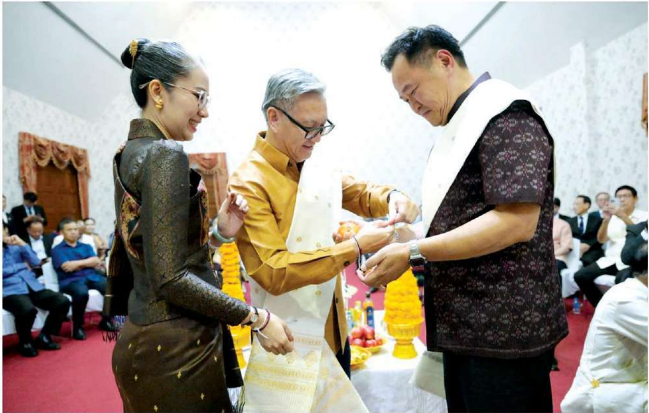
▲ ร่วมงานสงกรานต์ : นายอนุทิน ชาญวีรกูล นายกรัฐมนตรีและรมว.มหาดไทย เข้าร่วมงานบุญสงกรานต์ปีใหม่ลาว โดยมี นายทองสะพาน พมวิหาน รองนายกรัฐมนตรีและรมว.ต่างประเทศ สปป.ลาว พร้อม นางวาดสะหามา พมวิหาน ภริยา และนายสีสะหวาด อินพะจัน เอกอัครราชทูต สปป.ลาว ประจำประเทศไทย ให้การต้อนรับ

ทักษะตามความสนใจและความต้องการของตลาดแรงงาน เพื่อให้การรับราชการทหารเป็นเส้นทางพัฒนาศักยภาพของเยาวชนและเป็นฐานรองรับการปรับระบบเกณฑ์ทหารไปสู่ระบบสมัครใจในระยะยาว เสริมศักยภาพอาสาสมัครภาคินแดนทั้งการฝึกทักษะและการประสานงานร่วมกับกองทัพ โดยเฉพาะกำลังที่ปฏิบัติหน้าที่ในพื้นที่สามจังหวัดชายแดนภาคใต้