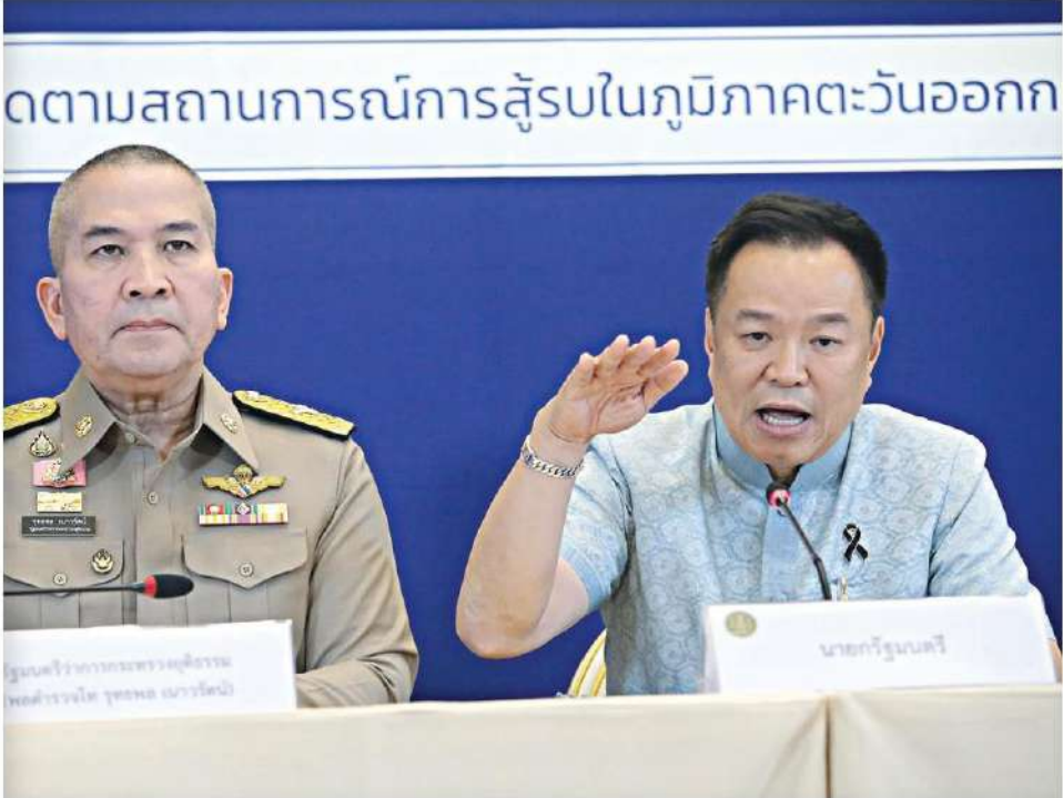
▲ แอลงเข้ม...นายอนุทิน ชาญวีรกูล นายกรัฐมนตรี และ รมว.มหาดไทย พร้อมหลายหน่วยงานที่เกี่ยวข้อง แอลงข่าวผลการประชุมศูนย์บริหารและติดตามสถานการณ์การสู้รบในภูมิภาคตะวันออกกลาง (ศบค.) ยอมรับมีการกักตุนน้ำมัน และถ่วงเวลารอปรับขึ้นราคา ณ ตึกถักตบดินทร์ ทำเนียบรัฐบาล

แฉพิรุณคลังสุราษฎร์ฯ ทำน้ำมันล่องหน 57 ล้านลิตร “นายกฯ” รับมีกักตุน ไม่สน อินทร์-พรหม ♦ อ่านต่อหน้า 2