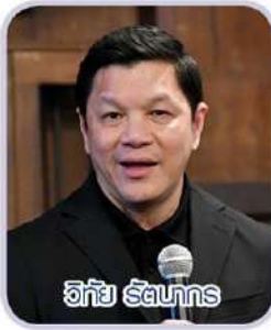
วิทัย รัตนากร

นอกจากนี้ ธปท. ได้ออกมาตรการใหม่หลายอย่างเพื่อแก้ปัญหาเศรษฐกิจไทย ทั้งการควบคุมเงินสด เริ่มมาตรการตรวจสอบการเบิก-ถอนเงินสดเกิน 5 ล้านบาท เพื่อป้องกันการนำเงินไปใช้ในธุรกิจสีเทา คอรัปชัน, การจัดการค่าธรรมเนียมธนาคารซึ่งกำลังหารือเพื่อกำหนดมาตรฐานค่าธรรมเนียมให้เท่าเทียมกันไม่ให้เป็นภาระต่อเอสเอ็มอี เช่น ค่าธรรมเนียมการโอนถอนข้ามเขตที่ปรับเป็นศูนย์ และการควบคุมค่าธรรมเนียมการขอสินเชื่อ ขณะเดียวกันยังมีการออกโครงการ เอสเอ็มอี เครดิต บูสต์