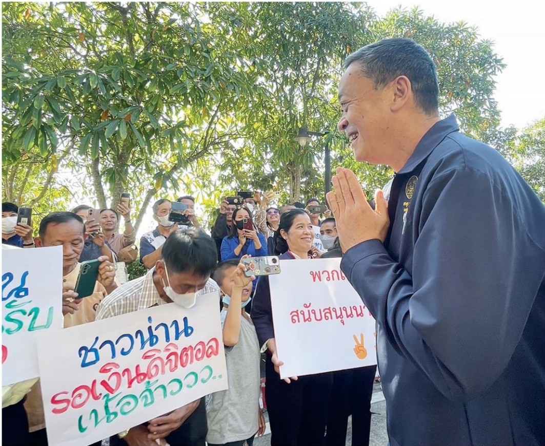
รับนายกฯ - นายเศรษฐา ทวีสิน นายกรัฐมนตรี และรมว.คลัง ยิ้มแย้มยกมือไหว้ทักทายชาวบ้านที่รอต้อนรับ ระหว่างไปติดตามประเด็นการเจรจาแก้ไขหนี้หอระบบที่หน้าศาลากลางจังหวัดน่าน โดยนายกฯ เตรียมผุดตลาดนัดแก้หนี้ทุกจังหวัด เมื่อ 23 ธ.ค.

อธิบดีกรมการปกครอง และหัวหน้าส่วนราชการในพื้นที่รอให้การต้อนรับ