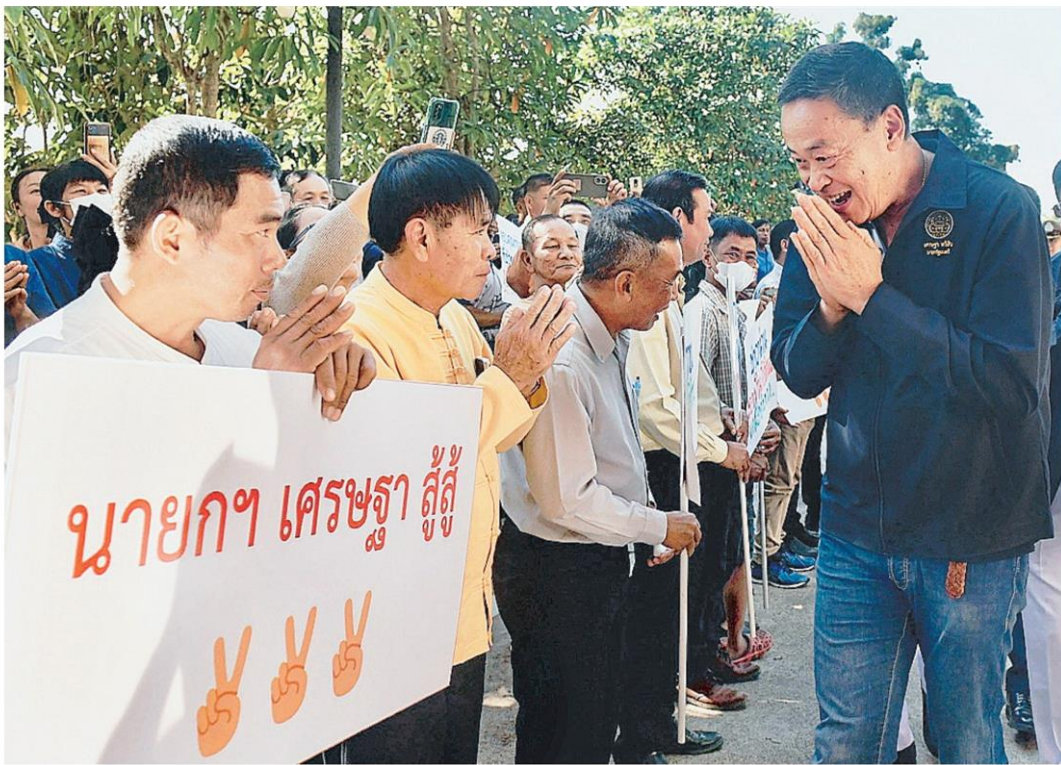
▲ สางหนี้ชว่นาน นายเศรษฐา ทวีสิน นายกฯและ รมว.คลัง ยกมือรับไหว้ทักทายพี่น้องชว่นานที่มาต้อนรับ ขณะลงพื้นที่ประชุม ติดตามแก้ปัญหาหนี้ในระบบของ จ.น่าน โดยนายกฯสั่งกำชับฝ่ายความมั่นคงเรียกเจ้าหนี้กับลูกหนี้มาไกลเกลี่ย ย้ำลูกหนี้ต้องปลอดภัย.

กรณีที่นายทักษิณ ชินวัตร อดีตนายกรัฐมนตรี ได้รับอนุญาตให้เข้าพักรักษาตัวที่ชั้น 14 โรงพยาบาล ตำรวจจนเกินกำหนดการพักรักษาพยาบาลนอก เรือนจำ โดยครบ 120 วัน เมื่อวันที่ 22 ธ.ค. ยังคงเป็น ประเด็นทางการเมืองที่พุ่งเป้าไปที่รัฐบาลพรรค เพื่อไทย ล่าสุดนายเศรษฐา ทวีสิน นายกฯ และ รมว.คลัง ยืนยันมั่นใจว่ากรรมราชทัณฑ์ได้ดำเนินการ อย่างถูกต้องตามกฎหมาย