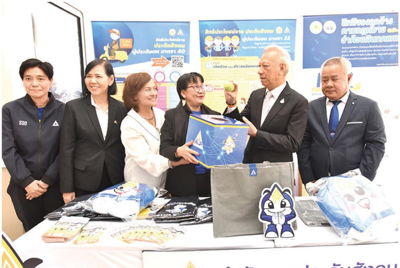
จ่อเพิ่มค่าแรง - นายพิพัฒน์ รัชกิจประการ รมว.แรงงาน แถลงมอบของขวัญปีใหม่ 2567 ให้แก่ผู้ใช้แรงงานทั่วประเทศ พร้อมระบุว่าคณะกรรมการค่าจ้างจะมีการประชุมในช่วงต้นปี 2567 เพื่อพิจารณาปรับค่าจ้างขั้นต่ำ รอบ 2 เป็นของขวัญวันสงกรานต์ปี 2567 ที่กระทรวงแรงงาน เมื่อวันที่ 22 ธันวาคม

ที่ทำเนียบรัฐบาล นายอนุทิน ชาญวีรกูล รองนายกรัฐมนตรีและรัฐมนตรีว่าการกระทรวงมหาดไทย กล่าวถึงการร่วมประชุมกับ น.ส.แพทองธาร ชินวัตร ประธานกรรมการพัฒนาซอฟต์แวร์แห่งชาติ เกี่ยวกับงานสงกรานต์ ปี 2567 เมื่อวันที่ 21 ธันวาคม ที่ผ่านมาว่า เทศกาลสงกรานต์ถือเป็นซอฟต์แวร์เวอร์ชันหนึ่ง โดยมีแนวคิดต้องการให้เทศกาลสงกรานต์ยกระดับเป็นเทศกาลระดับโลกให้ทุกคนได้รู้จักในช่วงเดือนเมษายน ซึ่ง น.ส.แพทองธาร ได้มาประชุมที่กระทรวงมหาดไทย เพื่อขอให้กระทรวงมหาดไทยให้ความร่วมมือและสนับสนุน ซึ่งกระทรวงมหาดไทยก็ยืนยันว่าพร้อมให้การสนับสนุน อาทิ การใช้สถานที่ การประชาสัมพันธ์ และการอำนวยความสะดวกต่างๆ ให้แก่นักท่องเที่ยว และขออย่าว่ากระทรวงมหาดไทยไม่ได้เป็นผู้จัดหลัก แต่เป็นทางคณะกรรมการซอฟต์แวร์ที่มีหน้าที่หลักที่ต้องการให้รูปแบบของเทศกาลสงกรานต์ออกมาเป็นแบบใด