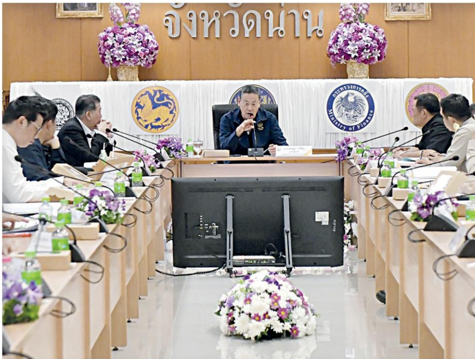
▲แก้หนี้...นายเศรษฐา ทวีสิน นายกฯ และรมว.คลัง เดินทางถึง ศาลากลางจังหวัดน่าน ทักทายประชาชนที่มารอต้อนรับ จากนั้นเป็น ประธานการประชุมหารือร่วมกับหน่วยงานที่เกี่ยวข้องเพื่อติดตามการ เจรจาแก้หนี้ในระบบในพื้นที่ จ.น่าน ผุดไอเดียตลาดนัดแก้หนี้

เมื่อเวลา 13.52 น. วันที่ 23 ธ.ค. นายเศรษฐา ทวีสิน นายกฯ และ รมว.คลัง พร้อมคณะเดินทางถึงศาลากลางจังหวัดน่าน ด้วยรถยนต์โตโยต้า อัลพาร์ด ทะเบียน กฉ 5353 น่าน โดยมีประชาชนกว่า 200 คน ท้อปายรอให้การต้อนรับ จากนั้นเวลา 14.00 น. นายกฯเป็นประธานการประชุมหารือ ร่วมกับหน่วยงานที่เกี่ยวข้อง เพื่อติดตามการเจรจาแก้หนี้ในระบบในพื้นที่ จ.น่าน โดยมีนายภูมิธรรม เวชยชัย รอง นายกฯ และ รมว.พาณิชย์ นายอนุทิน ชาญวีรกูล รองนายกฯ และ รมว.มหาดไทย นายจุลพันธ์ อมรวิวัฒน์ รมช.คลัง นายอรรถิษฐ์