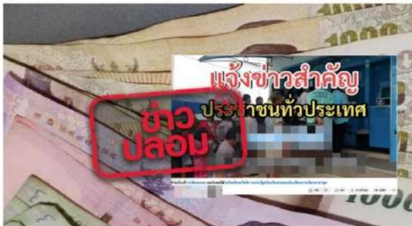
คลังแจงแล้ว ปมเตรียมโอนเงิน 800 เข้าบัตรคนจน ถึงสิ้นเดือนนี้

เพื่อให้ประชาชนได้รับข้อมูลข่าวสารจากกระทรวงการคลัง สามารถติดตามได้ที่เว็บไซต์ www.mof.go.th หรือโทร. 1689