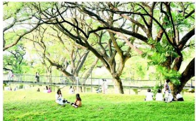
สวนป่าเบญจกิติ สวนสาธารณะแห่งใหม่ที่ได้รับ ความนิยมมาก

“ส วนป่าเบญจกิติ” ช่วงนี้กำลังฮอตหลังเปิดให้ประชาชนได้เข้าใช้งานสวนสาธารณะแห่งใหม่ กระแสตอบรับล้นหลาม มีคนเมือง โดยเฉพาะชาว New Gen พากันมาพักผ่อนหย่อนใจ มาออกกำลังกาย เดินเล่น ถ่ายรูป