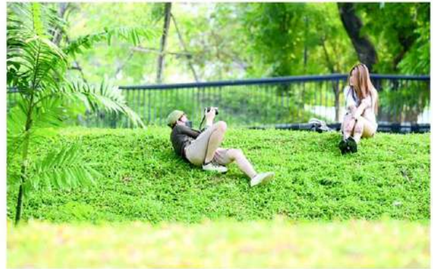
หามุมสวยๆ ถ่ายรูป กิจกรรมยอดฮิต