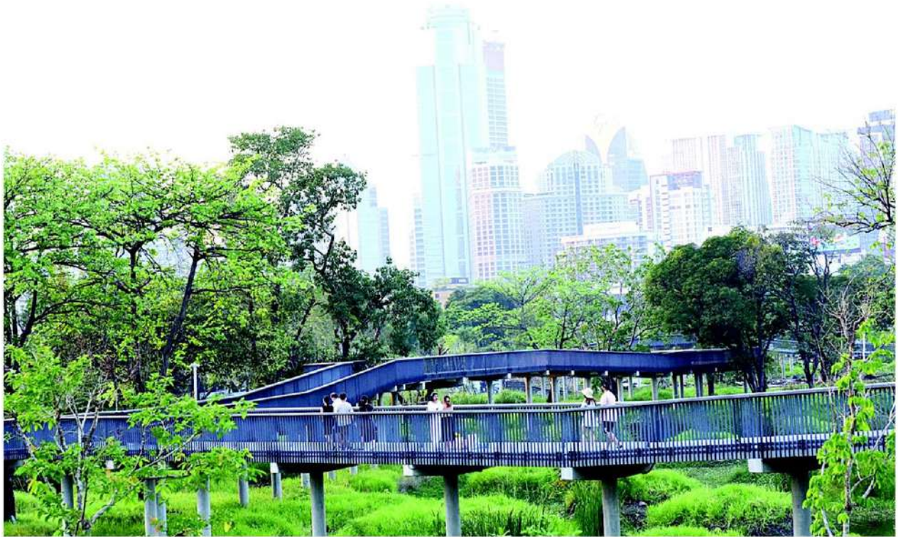
ทางเดินลอยฟ้าระยะทาง 1.6 กม. เส้นทางชมธรรมชาติ ทิวทัศน์เมือง