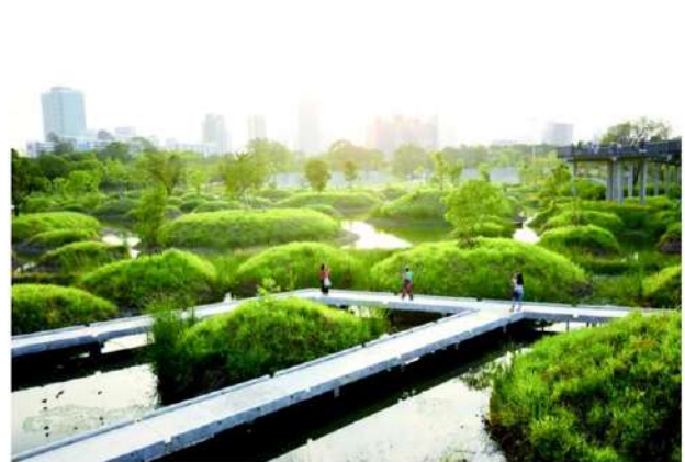
เดินเล่นชิลๆ บนทางเดินผ่านเกาะต้นไม้

เพื่อนมาเดินเล่นที่สวนเบญจกิติ เข้ามาสถานที่จริงๆ ครั้งแรก ดีมาก วิวสวยมาก โดยเฉพาะช่วงเย็นแดดเริ่ม เจอแสงสวยๆ รอนจนพระอาทิตย์ตกยิ่งสวยไปอีก ตนชอบหาที่เช็คอินใหม่ๆ ชอบถ่ายภาพบนสกายวอล์กมีมุมให้ถ่ายตามจุดต่างๆ บรรยากาศที่นี่เจียบสงบ รู้สึกแอบปีได้ใกล้ธรรมชาติ จะต้องมาซ้ำแน่ๆ ชวนเพื่อนที่ยังไม่เคยมา เพราะเมื่อแชร์ภาพลงไอจี เพื่อนๆ ก็สนใจกันมาก ที่สำคัญดูเส้นทางสะดวก ลงบีทีเอสก็ยังสามารถเดินมาที่สวนเบญจกิติได้ ไม่ไกล