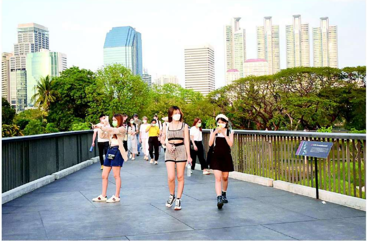
เหล่านิวเจนมาเดินเล่นเช็กอินบนสกายวอล์กสวนเบญจกิติ

500 คน ลีนเดือนธันวาคมเพิ่มเป็นหลักพัน เดือนมกราคมสถิติผู้ใช้บริการก็สูงขึ้น กระแสความแรงไม่หยุด เดือนกุมภาพันธ์ทะลุ 5,000 คนต่อวัน โดยเฉพาะวันอาทิตย์ที่ 20 ก.พ.ผ่านมา จำนวนคนใช้บริการ 11,500 คน สะท้อนให้เห็นความสนใจของประชาชนที่เปลี่ยนไป หันมาเที่ยวสวนสาธารณะและสัมผัสธรรมชาติเพิ่มมากขึ้น ตลอดจนพื้นที่สีเขียวปลอดโปร่งโล่งสบาย อากาศถ่ายเทสะดวก ตอบโจทย์วิถี New Normal