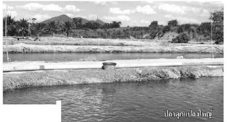
ปลาดุกแปลงใหญ่

คุณภาพตามตลาดต้องการคือ หัวใหญ่ เปอร์เซนต์แป้งสูง และผลิตมันเส้นสะอาด เก็บเกี่ยวมันอายุ 8 เดือนขึ้นไป สมัยก่อนปลูกตามธรรมชาติได้เพียงไร่ละ 3-4 ตันเท่านั้น แต่ปัจจุบันได้ 7-14 ตันต่อไร่แล้วแต่การบำรุงรักษา ถือว่าเพิ่มขึ้นอย่างเห็นได้ชัด เนื่องจากมีการปรับเปลี่ยนเวลาปลูก จากที่เคยปลูกเดือนมี.ค.-เม.ย. ขุดเดือนก.ค.-ส.ค.