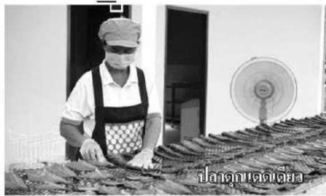
ปลาตุ้มแดงเดียว

มันได้ผลผลิตแค่ไร่ละ 5 ตัน ขาดทุน เพราะไม่มีน้ำ พอมทำแปลงใหญ่และปรับเปลี่ยนวิธีการปลูก พร้อมทำระบบน้ำหยด ไม่ขาดทุน แลมห่วงงานรัฐยังให้ความช่วยเหลือหลายอย่าง ในส่วนร.ก.ส.ให้กู้ดอกเบี้ยวราคาถูก 'ล้านละร้อย' และยังได้งบฯ ชุดเจาะน้ำบาดาล สมาชิกก็ได้รับเงินปันผล