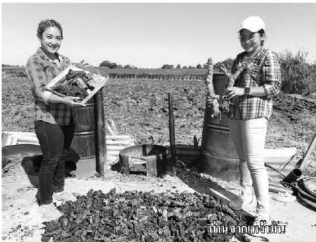
ถ่านจากแกลบมัน