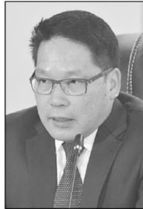
อุตตม สาวนายน

“ผมตั้งใจว่าหากมีมาตรการออกมาก็อยากจะทำให้มีผล ดังนั้นก็จะมีการใช้เม็ดเงินในการ