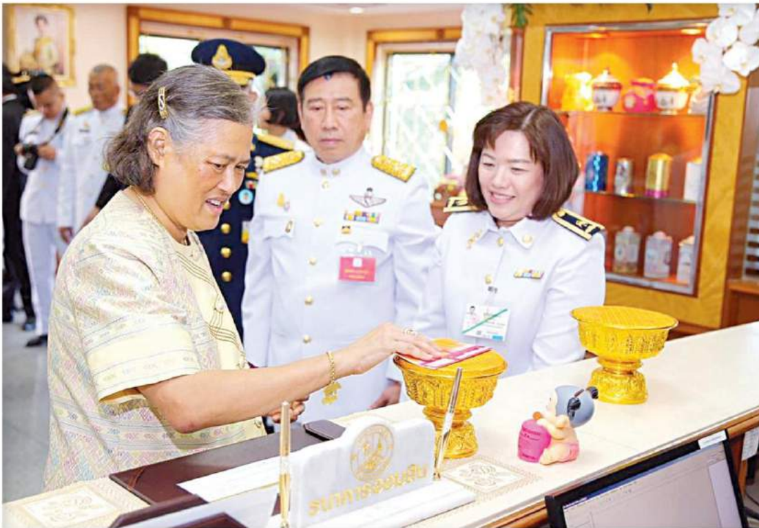
สมเด็จพระเทพรัตนราชสุดาฯ สยามบรมราชกุมารี พระราชทานพระราชวโรกาสให้ ผอ.ธนาคารออมสิน เข้าเฝ้าฯ ถวายการรับฝากเงิน เนื่องในโอกาสวันคล้ายวันพระราชสมภพ เจริญพระชนมายุ 64 พรรษา