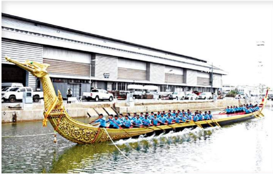
▲ ซ้อมฝีพาย...กองทัพเรือฝึกซ้อมฝีพายเรือพระที่นั่งสุพรรณหงส์ เป็นการถวายพระราชอิสริยยศเครื่องราชูปโภคตามโบราณราชประเพณี ในพระราชพิธีบรมราชาภิเษก ที่กรมอู่ทหารเรือธนบุรี เขตบางกอกน้อย