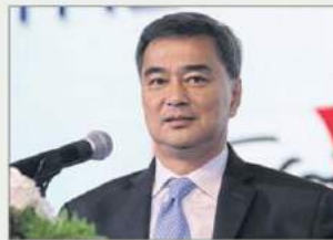
อภิสิทธิ์ เวชชาชีวะ

ประกาศหากผลการเลือกตั้งรอบนี้ ออกมาได้ไม่ถึงจำนวนตามเป้า หรือ หากไม่เกิน 100 เสียง พร้อมจะลา ออกจากตำแหน่งหัวหน้าพรรค ■