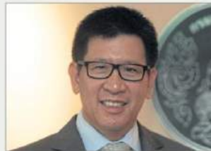
เอกนิติ นิติทัณฑ์ประภาศ

เอกนิติ นิติทัณฑ์ประภาศ อธิบดี กรมสรรพากร เข้าทำงานประกาศ นโยบายชัดเจนว่าจะต้องขับเคลื่อน ให้กรมสรรพากร เป็นกรมภาษี