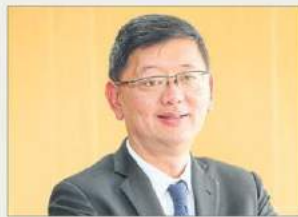
พชร อนันตศิลป์

ถือเป็นอธิบดีมือใหม่ไฟแรงติดไวกุตรง สำหรับ พชร อนันตศิลป์ อธิบดีกรมสรรพสามิต ที่เข้ามาก็อยากหนุนให้การนำเข้าบุหรี่ไฟฟ้า ถูกกฎหมาย จะได้เก็บภาษีเข้าประเทศมากขึ้น เพราะทุกวันนี้ก็มีการนำเข้ามาขายแบบผิดกฎหมายผ่านโซเชียลกันเกลื่อนเมือง