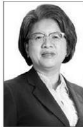
รินวดี สุวรรณมงคล

รับช่วงไฮซีชันการท่องเที่ยว ที่ งานนี้ “ทรงวิทย์ ฐิติปัญญา” ผู้บริหารคนเก่งบมจ.ชินเนอร์เจติก ออโต เพอร์ฟอร์แมนซ์ หรือ ASAP เตรียมความพร้อมเต็มพิกัด เสริมพอร์ตรถยนต์โตโยต้า C-HR ใหม่ล่าสุด ให้แก่พอร์ตรถเช่าระยะสั้น หวังสร้างประสบการณ์ และความประทับใจในการให้บริการรถยนต์ให้เช่าของ ASAP ที่โดดเด่นเหนือคู่แข่ง ดอกย้ำจุดขาย “รถใหม่ ไม่น้อย” กินขาดคู่แข่งกันเลยทีเดียว...■■ ใครว่าซื้อซิมมือถือต้องไปที่ร้านขายมือถือเท่านั้นตอนนี้ SINGER เจ้าแห่งตลาดสินเชื่อเงินผ่อนที่มีเครือข่ายครอบคลุมตลาดทั่วประเทศ จับมือเอาไอเอสยูคตลาดจิมและอินเตอร์เน็ตบ้านไฟเบอร์เครือข่ายสัญญาณเอไอเอส ซึ่งเป็นการต่อขยายจากการประกาศ Exclusive Partnership ระหว่าง JMART หรือบมจ.เจมาร์ท ในฐานะบริษัทแม่ กับ เอไอเอส หรือ บมจ.แอดวานซ์ อินโฟร์ เซอร์วิส ด้านบอสใหญ่ซิงเกอร์ “กิตติพงษ์ กนกวิไลรัตน์” ส่งชก ในอนาคตยังเตรียมปล่อยหมัดเด็ดร่วมกันอีก ในการหาลูกค้าใหม่เครือข่ายเอไอเอส เดินหน้าเจาะกลุ่มลูกค้าเป้าหมายผ่านตัวแทนขายของซิงเกอร์ทั่วประเทศ ประเดิมแล้วที่ จ.สุราษฎร์ธานี ภูเก็ต และสตูล สเปเชียลดีลของยักษ์ใหญ่ในวงการขนาดนี้ บอกได้คำเดียวว่าไม่ธรรมดาแน่นอน...■■ คณะรัฐมนตรี(ครม.) มีมติอนุมัติตามที่กระทรวงการคลังเสนอแต่งตั้ง “รินวดี สุวรรณมงคล” ให้ดำรงตำแหน่ง เลขาธิการสำนักงานคณะกรรมการกำกับหลักทรัพย์ และตลาดหลักทรัพย์ (เลขาธิการสำนักงาน ก.ล.ด.) ตั้งแต่วันที่ 1 พฤษภาคม 2562 เป็นต้นไป ซึ่งถือเป็นผู้ที่มีความรู้ความสามารถ ปัจจุบันดำรงตำแหน่งอธิบดีกรมบังคับคดีและเคยเป็นอดีตลูกหม้อทำงานที่สำนักงานก.ล.ด.ก่อนข้ามหัวโยกไปกระทรวงยุติธรรม ■■