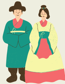
อ้างอิง: - World Bank - OECD