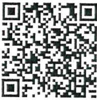
เอกสารแนบ ๑ - ๔